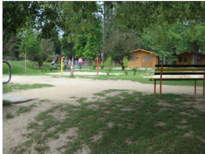
Gemeindeamt und Kindertagesstätte