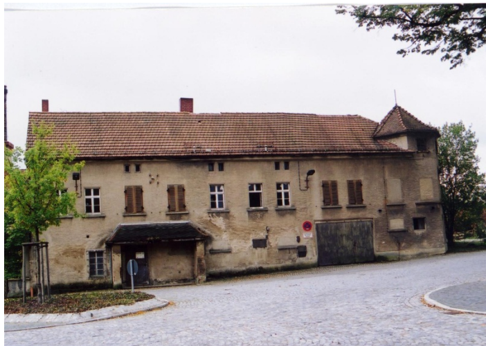
Ehemalige Brauerei - alt