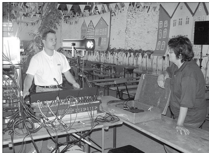
Probenbild früherer Jahre

Es ist schon eine schöne Tradition, dass sich Laienspieler aus Bretnig-Hauswalde und Umgebung jährlich treffen, um bei wochenlangen Proben zu singen, zu tanzen und zu schauspielern. Dieses Jahr wurden neue Wege beschritten und bei über 60 Probe-Stunden in der Vorbereitung ist bei dem neuen Revue-Programm das Augenmerk aufs Schauspielern gelegt worden. Zu sehen ist im Erbgericht in Rammenau eine 90-minütige lustige Verwechslungskomödie, die bereits bei der Premiere anlässlich der Bretniger Kirmes sehr viel Applaus bekommen hat. Die Freude sieht man jeden Einzelnen auf der Bühne an.