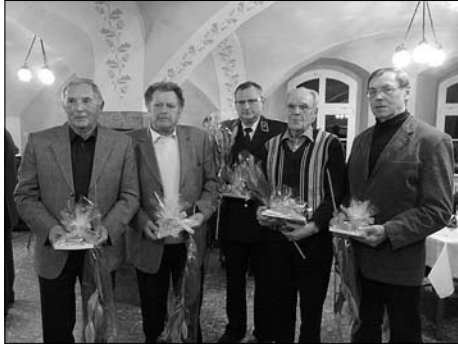
Sechs Vereinsmitglieder aus dem Rödertal wurden für ihr ehrenamtliches Engagement geehrt.