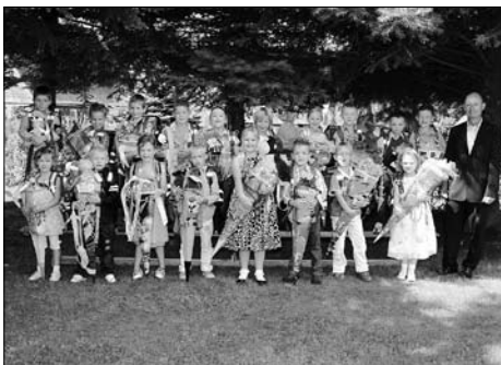
Endlich ist es soweit! – 20. August, Schuleingang