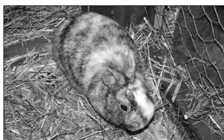
52. Rödertalschau der Rassekaninchen