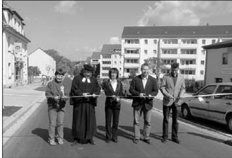
Rathausstraße am 5. Mai wieder freigegeben.