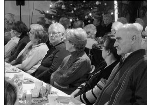
Seniorenweihnachtsfeier in der Festhalle