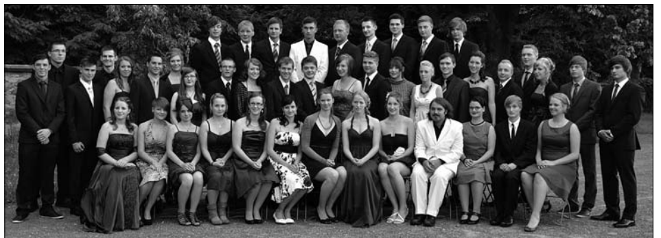
Am 24. Juni erhielten 45 Abiturienten des Gymnasiums ihre Zeugnisse.