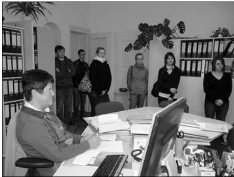
Im Rahmen der „Woche der offenen Unternehmen“ erhielten Schüler einen Einblick in Großbröhrdorfer Firmen.