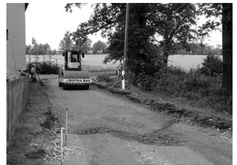
Ein erster Abschnitt der Langen Straße wurde saniert.