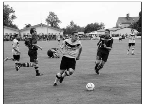
Zuschauerrekord beim Spiel des SC 1911 gegen Dynamo Dresden anlässlich des Vereinsjubiläums