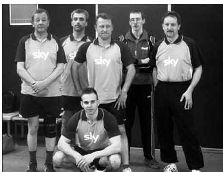
Die Sektion Tischtennis behauptet sich in der Bezirksklasse.