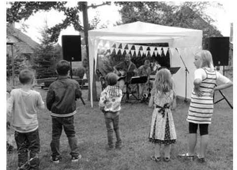
Livemusik zum Tag der offenen Tür im Agnesheim am 12. August