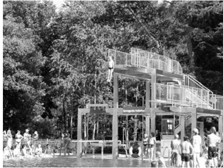
Sommerlaune zum Badfest im Massenei-Bad