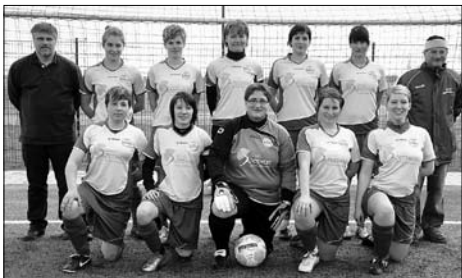
Am 27. März gewinnt die Frauen-Fußballmannschaft des SC 1911 ihr viertes Playoff-Spiel in Folge.