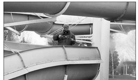
Letzte Handgriffe für den Saison-Start im Massenei-Bad