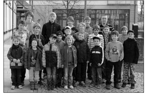
Erfolgreiche Nachwuchsarbeit beim SC 1911, Abt. Schach – Status eines Talentstützpunktes verliehen.