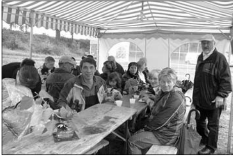
120 wetterfest gekleidete Besucher kamen trotz Regen zum Drachenfest.