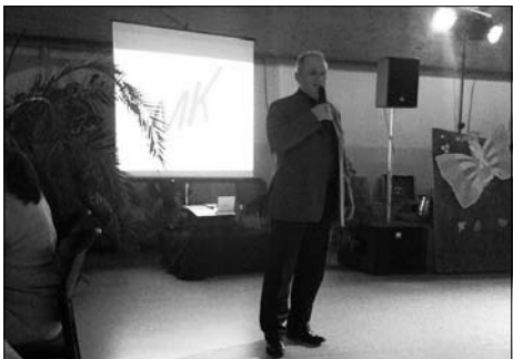
7. Tanz in den Frühling des Gewerbevereins Rödertal und Umgebung e.V.