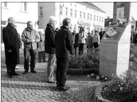
Gedenkveranstaltung anlässlich der Reichspogromnacht vor 73 Jahren am 9. November