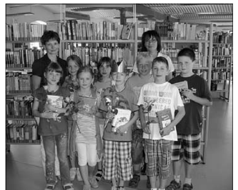
Die Lesekönige 2011 vom Rödertal