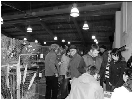
51. Rassekaninchen-Kreisschau lockt viele Gäste nach Großröhrsdorf.