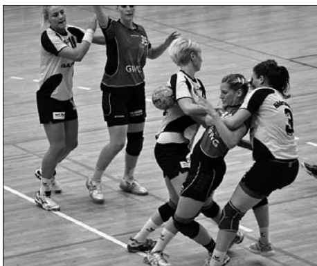
Die Rödertalbienen des HCR schließen die Meisterschaftssaison als Vizemeister ab.