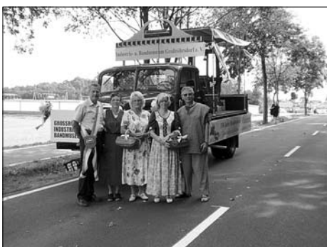
Drei Großröhrsdorfer Vereine präsentieren sich zum Tag der Sachsen in Kamenz.