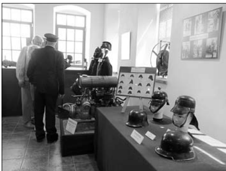
Eröffnung einer Dauerausstellung historischer Feuerwehrtechnik im Juni