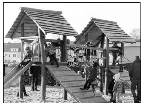
Neuer Spielplatz auf dem ehemaligen Gelände der Tischfabrik eingeweiht.