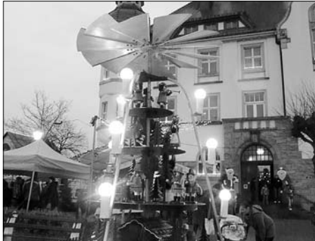
Wie in jedem Jahr fand am 2. Advents-Wochenende der traditionelle Weihnachtsmarkt statt.