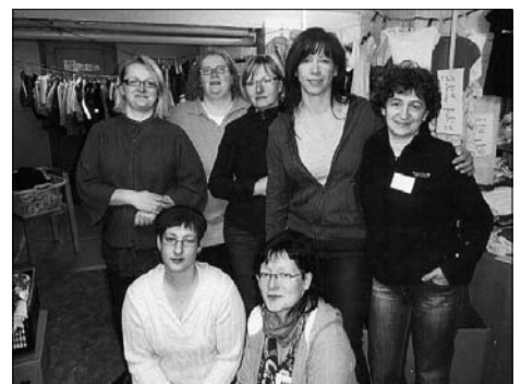
Engagierte Muttis organisierten die Kindersachenbörse in der AWO-Kita.