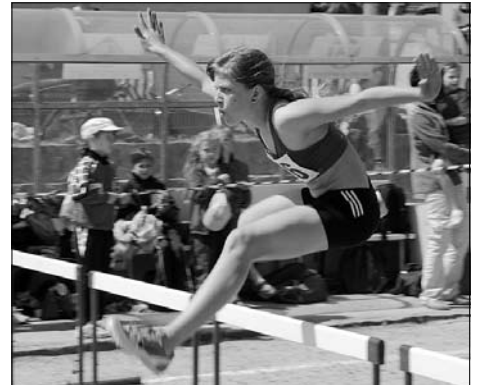
Am 8. Mai fanden die offenen Mehrkampf-Kreismeisterschaften der Leichtathletik im Rödertalstadion statt.