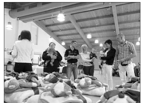
Auch der 8. Neugeborenenempfang wurde zum Erfahrungsaustausch junger Eltern intensiv genutzt.