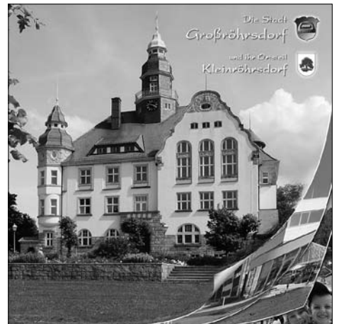
Seit November ist die neue Stadtbroschüre erhältlich.