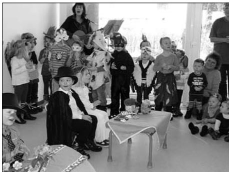
Ganz traditionell wurde die Vogelhochzeit am 25.01. in den Kitas gefeiert.