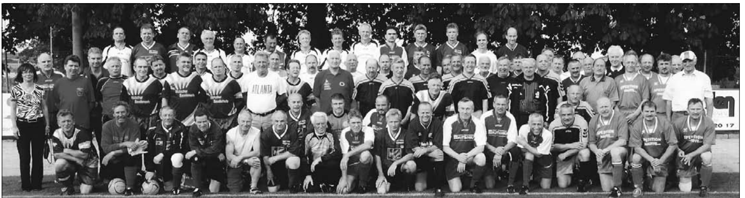
Mit einem Spiel der „Alten Herren“ eröffnet der SC 1911 seine Festwoche anlässlich 100 Jahre Fußball und 90 Jahre Schach.