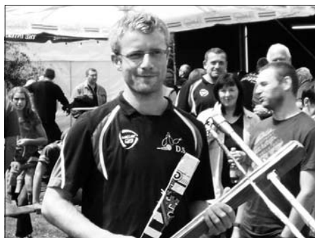
Sommerfest an der Kleinröhrsdorfer Kegelbahn im Juni