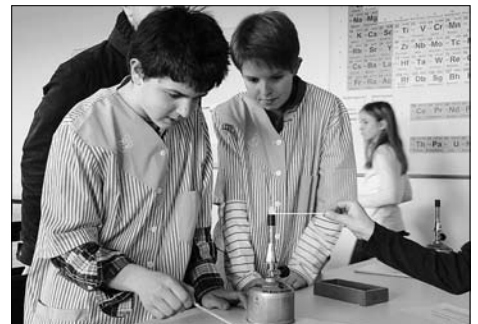
Tag der offenen Tür am 4. März im Ferdinand-Sauerbruch-Gymnasium