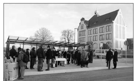
Busplatz mit vier neuen Bussteigen und Parkplätzen eingeweiht.