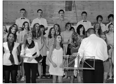
13. Galeriekonzert des Großröhrsdorfer Gymnasiums