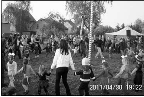
Maibaumstellen und Hexenfeuer im Rödertal