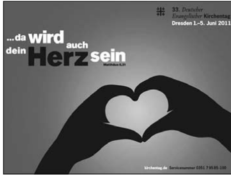
Auch Großröhrsdorf war beim 33. Ev. Kirchentag in Dresden Anfang Juni vertreten.