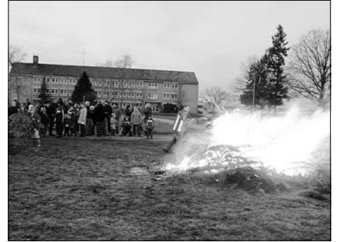
Weihnachtsbaumverbrennen des Vereins „Einigkeit“ e.V.