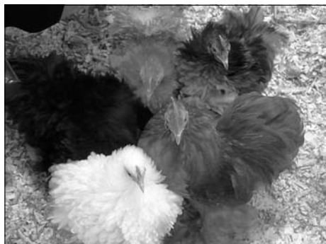
Über 400 Hühner und Tauben stellte der Rassegeflügelzüchterverein in diesem Jahr aus.