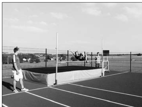
Hochsprunganlage auf dem Jahnsportplatz zur Nutzung freigegeben.