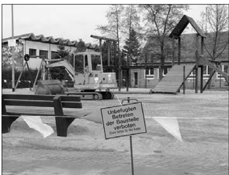
6000,- € investierte die Stadt, um den Spielplatz am Gymnasium zu erneuern.