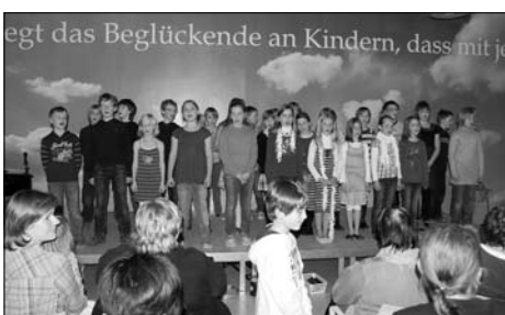
Erstes Galeriekonzert in der Praßerschule