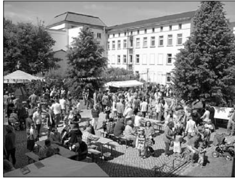
Das Einigkeitsfest findet erstmals an der Kulturfabrik statt.