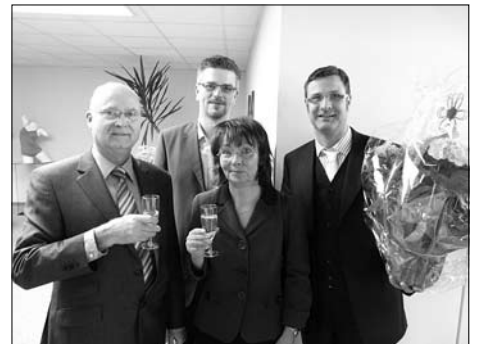
Am 15. Februar blickte die Thieme Fashion GmbH auf eine 100jährige Firmengeschichte zurück.