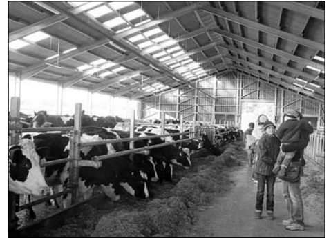
20 Jahre Großröhrsdorfer Agrargenossenschaft eG