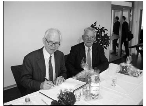
Enkel Sauerbruchs zum Symposium am Gymnasium