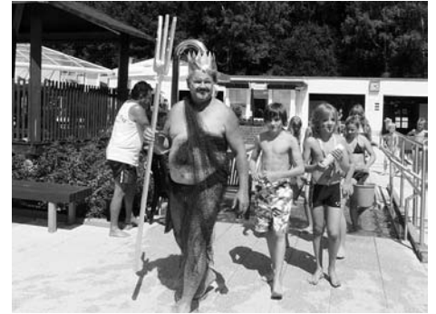
Auch den Neptun konnten wir am 10. Juli begrüßen.