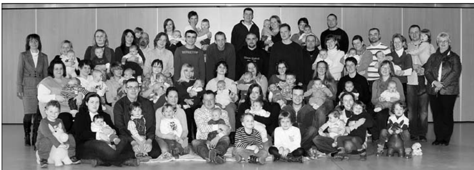
25 frischgebackene Eltern mit ihren Babys trafen sich zum 7. Neugeborenenempfang.