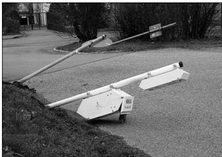
Leider gibt es im Jahr 2011 vermehrt Vandalismus in unserer Stadt.