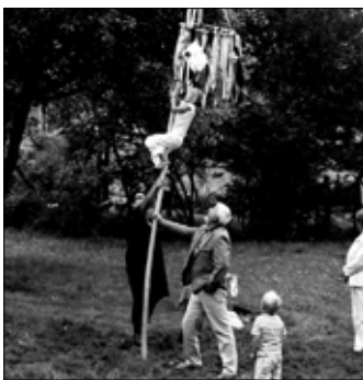
Die Ev.-Luth. Kirchgemeinde feierte am 28. August den Hofschwof.