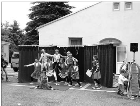
Motto des Kinderfestes der AWO-Kita „Manege frei“