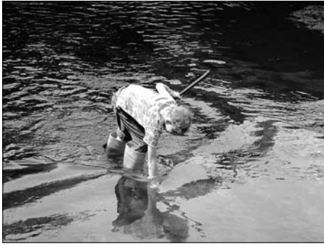
Das Jugendhaus reinigt wieder die Röder.