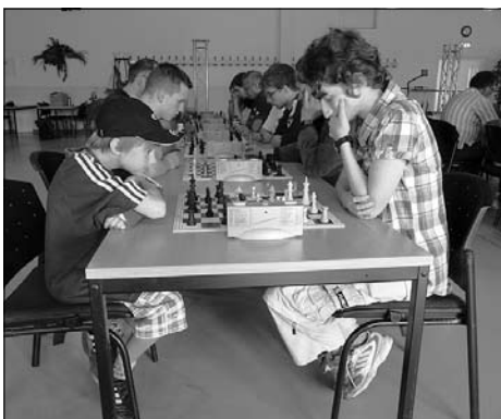
Sächsische Familienmeisterschaft und Einzelmeisterschaft im Blitzschach fanden in diesem Rahmen in der Festhalle statt.