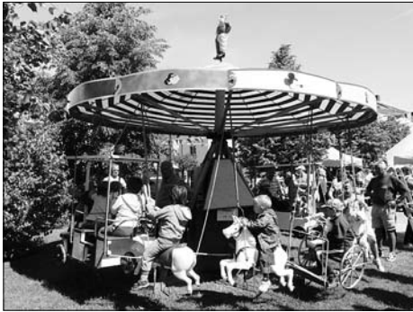
Viele Vereine, Einrichtungen und Schulen beteiligten sich wieder am Einigkeitsfest und gestalteten gemeinsam ein buntes Programm.