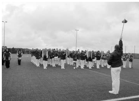
40 Jahre Spielmannszug Kleinröhrsdorf