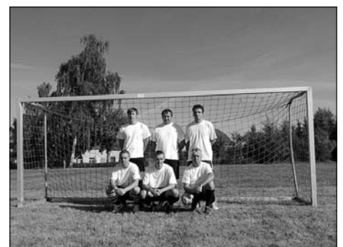
Interessante und faire Spiele zum Fußballturnier des Fördervereins Kleinröhrsdorf e.V.