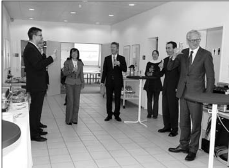
Spatenstich für einen Erweiterungsbau der Firma Bürkert