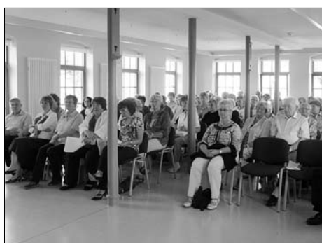
Der 1. Seniorentreff ist der Auftakt zu einer erfolgreichen Reihe.