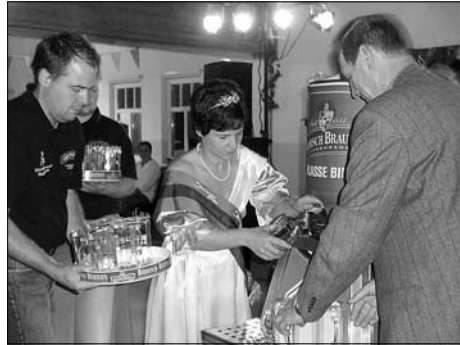
Am 8. Oktober wurde die Bockbiersaison 2011/2012 eröffnet.