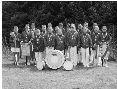
Der Kleinröhrsdorfer Spielmannszugnachwuchs holt Bronzemedaille bei den Landesmeisterschaften.