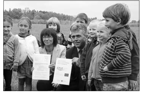
1,056 Mio. € Fördermittel für Kita-Neubau in Kleinröhrsdorf