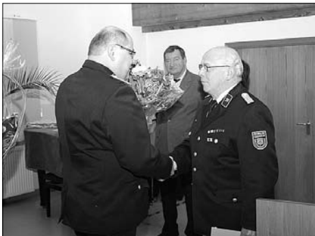
Auszeichnungen und Beförderungen im Rahmen der Jahreshauptversammlung der FF Großröhrsdorf