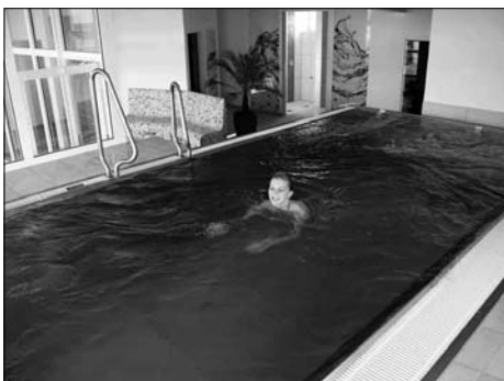
Mit dem neuen Sanitär- und Wellnessgebäude beginnt eine neue Ära in der LuxOase.