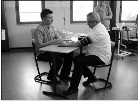
Zum Tag der offenen Tür im IGS informierten sich Jugendliche über das Ausbildungsprogramm.