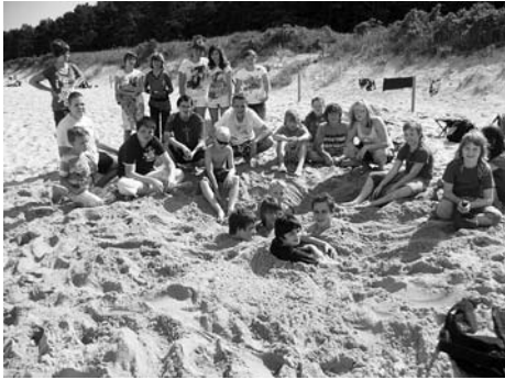
Ferienaktion des Vereins Mensch für Mensch Rödertal e.V.