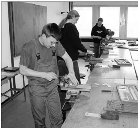
Im Oktober fusionierten der Ausbildungsverbund Großröhrsdorf mit dem Bildungszentrum Kunststoffe Polysax in Bautzen