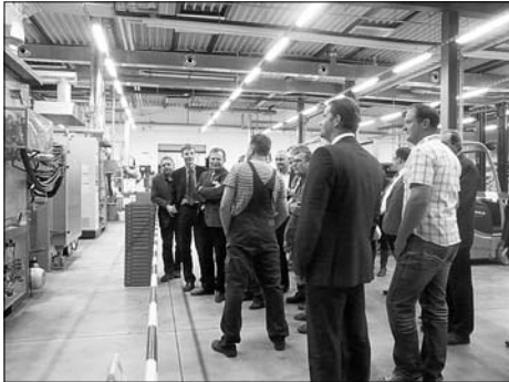
Die CleanDieselCeramics GmbH war Gastgeber für das 6. Firmen-Info-Treffen.