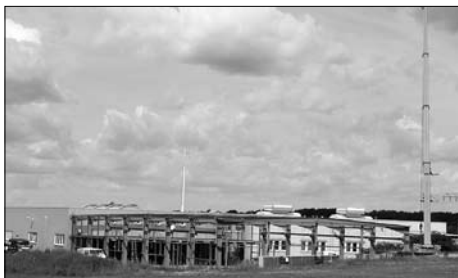
Vorbereitungen für einen Erweiterungsbau der Firma KDS Radeberger Präzisions- Formen und Werkzeugbau beginnen im April.