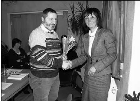
Kleingartenverein „Rödertal“ e.V. wählte neuen Vorstand am 23.02.2011.