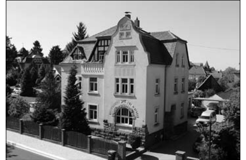
20 Jahre Bestattungsinstitut Schuster