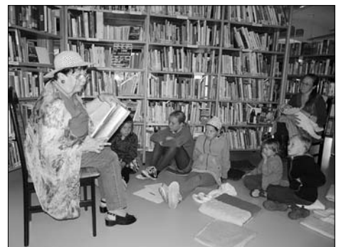
125 Jahre Volksbücherei wurden am 2. Juli gefeiert.