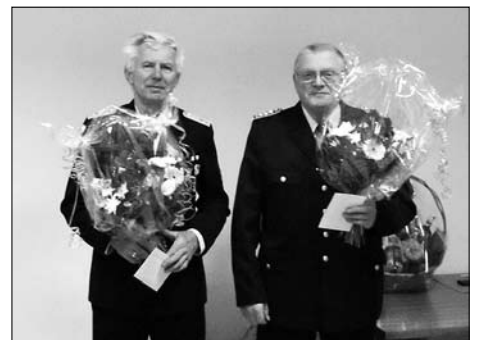
FF Kleinröhrsdorf blickte auf ein einsatzreiches Jahr 2010 in ihrer Jahreshauptversammlung zurück.