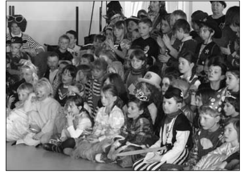
Närrisches Treiben in den Kindergärten