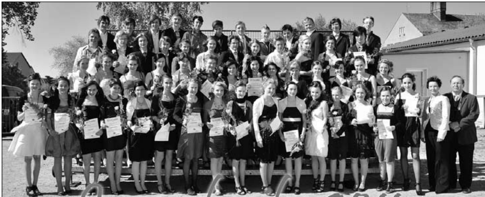
Jugendweihe – ein Fest für 's Leben am 7. Mai