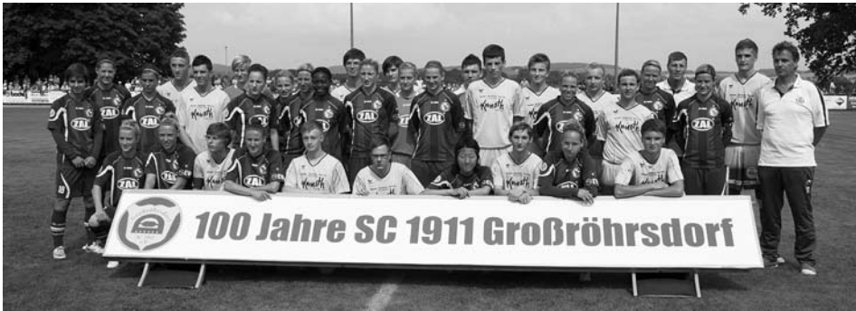
1200 Zuschauer bejubelten das Spiel des SC 1911 gegen Turbine Potsdam anlässlich des Vereinsjubiläums.