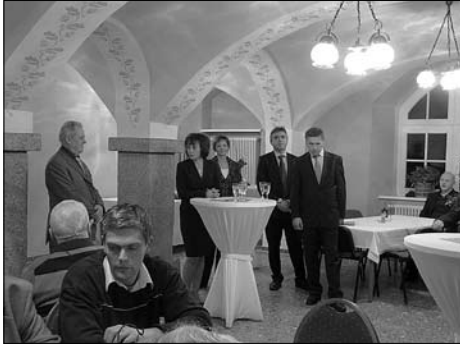
8. Neujahrsempfang des Gewerbevereins Rödertal u. Umgebung e.V.