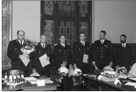
Im September wählte die Feuerwehr eine neue Leitung.