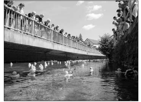
Neben dem traditionellen Entenrennen gab es auch ein Nachtentenrennen.