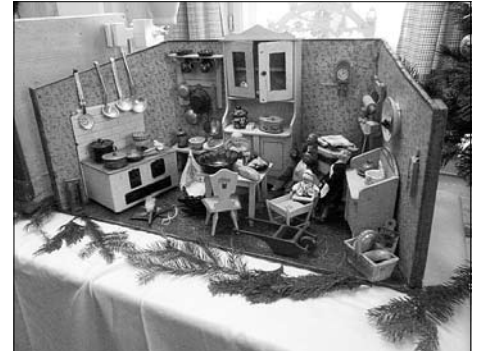
Sonderausstellung „Historische Puppenküchen“ im Heimatmuseum