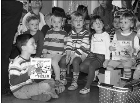
Kita „Waldhäuschen“ erhält musikalisches Qualitätssiegel.