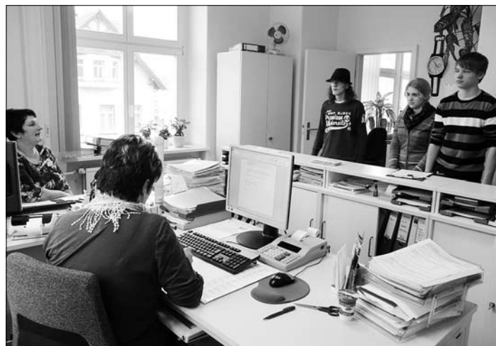
Schüler im Gespräch mit den Mitarbeiterinnen in der Kämmererei

Bereits zum vierten Mal bot die Stadtverwaltung Großröhrsdorf interessierten Schülern im Rahmen der Aktion „Schau rein! Woche der offenen Unternehmen in Sachsen“ die Möglichkeit, sich über die Ausbildung und den Beruf des Verwaltungsfachangestellten im Rahmen von kleinen Gruppen und persönlichen Gesprächen ganz individuell zu informieren. Dieses Angebot nahmen dann auch am 13. März ein Mädchen sowie zwei Jungen aus Schulen der Umgebung in Anspruch.