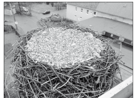
Mit Holz und Sägespänen wieder neu hergerichtetes Storchennest

die Naturschützer. Das wurde auch höchste Zeit, denn die Zugvögel erscheinen meist in der zweiten Hälfte des März bis Anfang April. Alle hoffen nun, dass die guten Voraussetzungen für die Störche auch wieder Nachwuchs gewährleisten. Wir warten sehnsüchtig auf frühlingshaftes Wetter und die ersten Störche im Rödertal.