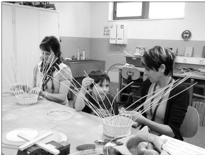
Ergotherapeuten stellten Techniken wie Flechten und Malen zur Rehabilitation vor.

Am Samstag, dem 17. März lud das Institut für Gesundheit und Soziales gGmbH (IGS) auf der Melanchthonstraße zum Tag der offenen Tür ein. Insbesondere Jugendliche, die in diesem Jahr eine Ausbildung beginnen, nutzten die Möglichkeit, um sich einen Eindruck über die medizinische Berufsfachschule und deren breitgefächerten Ausbildungsangebote sowie Studienmöglichkeiten zu machen.