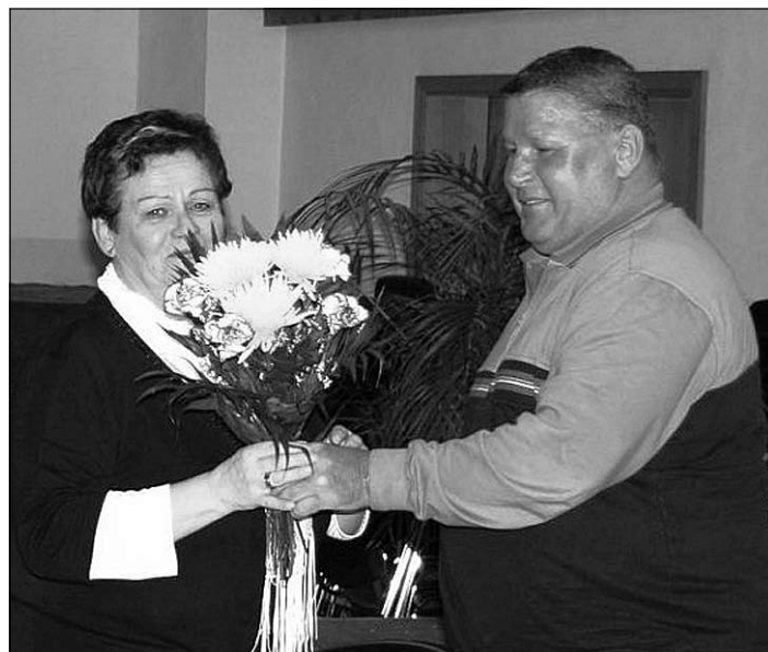
W. Preller v.TKK beglückwünscht die neue Vorsitzende des KGV „Rödertal“

Das Schlusswort hielt die neue Vorsitzende. Dabei sprach sie nochmals die Problematik der Anerkennung der Gemeinnützigkeit sowie die Umsetzung der gärtnerischen Prinzipien des Kleingartenwesens an.