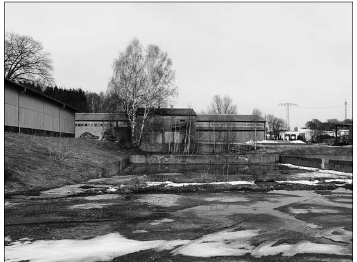
Gewerbefläche „Platro“ mit den ehemaligen Hallen des Futtermittelwerkes

dienten die ehemaligen Hallen des Großröhrsdorfer Trockenwerkes lediglich als Lagerhallen für Kleingewerbe aus Großröhrsdorf und der Umgebung. Doch auch dies war nicht von Dauer. Die Baulichkeiten befinden sich seit dem in einem völlig maroden Zustand und gefährden das gesamte Umfeld. 2011 kaufte die Stadt Großröhrsdorf die Gewerbebrache dem damaligen Eigentümer, der AGG Agrar Grundstücksgesellschaft mbH mit Sitz in Lichtenberg ab, mit dem Ziel, langfristig die Fläche von ca. 20.000 m 2 zu revitalisieren und das Gewerbegebiet abzurunden. Entsprechend dem Zuwendungsbescheid erfolgt nun ein fachgerechter Abriss der Industriegebäude, einschließlich aller befestigten Grundstücksflächen und die Beseitigung aller Altlasten. Die Fläche soll zur geplanten Nachnutzung als Vorhaltefläche für Gewerbe hergerichtet werden. Die Zuwendung des Fördermittelbescheides aus dem Europäischen Fonds für regionale Entwicklung (EFRE) umfasst 75 Prozent der dafür notwendigen Kosten. Den Restbetrag muss die Stadt Großröhrsdorf aus ihrem Haushalt finanzieren.