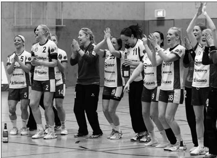
Sie qualifizierten sich schon drei Spieltage vor dem Saisonabschluss für den Aufstieg in die 2. Bundesliga - die Rödertalbienen.