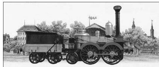
Abbildung: „Saxonia“, Verkehrsmuseum Dresden

der „Saxonia“ aus dem Jahre 1839 nicht. In den vergangenen Monaten „stöberten“ die Museumsmitarbeiter und Mitglieder des Großröhrsdorfer