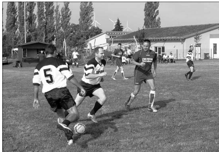
Spiel: Sonntagsrunde Großröhrsdorf - DRK Ohorn

10.00 Uhr war Anstoß. In den folgenden drei Stunden lieferten sich die Mannschaften attraktive und teilweise heiß umkämpfte Spiele. Es gab sowohl tolle Spielzüge als auch spektakuläre Tore zu sehen.