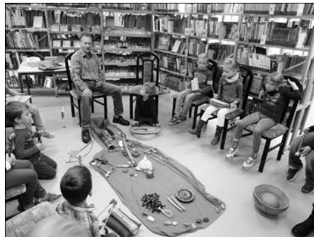
Klanghütte Dresden – ein musikalisches Märchen

Für den Medieneinkauf erhielten wir Fördermittel in Höhe von 8.000 €. Mit dem Eigenanteil der Stadt standen insgesamt 14.100 € zur Verfügung. So wurde es möglich, zügig auf aktuelle Trends und Kundenwünsche zu reagieren. Ein Grund mehr, sich unsere Angebote anzuschauen!