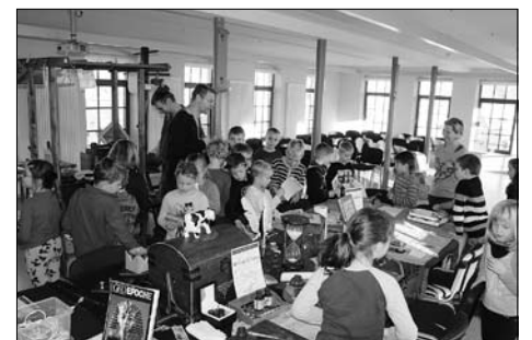
Wikinger – Die wilden Nordmänner

Übrigens finden Sie den Medienkatalog (über den Link „Bibo-Sax“), den Veranstaltungsplan und weitere Informationen im Internet: über www.grossroehrsdorf.de und unter „Freizeit, Kultur & Tourismus“ - Bibliothek werden Sie auf die Internetseiten der Bibliothek geleitet.