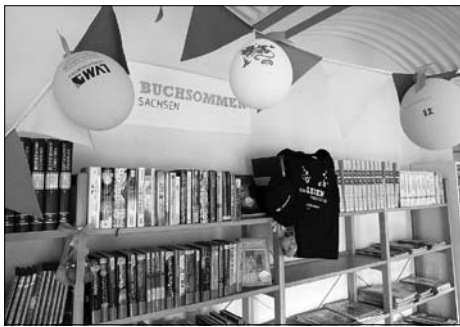
Buchsommer 2015 – Lesezeit

Mit dieser spontanen Bemerkung eines vom Alter her jungen Nutzers beginnt der Rückblick auf das Jahr 2015. Nicht nur dieser kleine Mann war von den „Schätzen der Bibliothek“ begeistert.