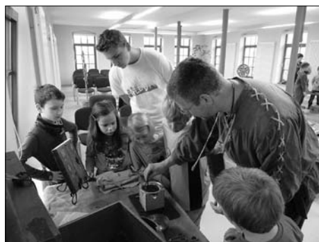
Abenteuer Buchstabe und Druckwerkstatt

Wir führten 30 Veranstaltungen durch. Im Vordergrund standen Projekte wie z.B. „KILIAN – Ein musikalisches Märchen“, „Lesen macht stark“ oder „Lernen mit allen Sinnen“ für Kindergartenkinder, für Schüler der Grund- und Mittelschule, des Gymnasiums sowie für Erwachsene.