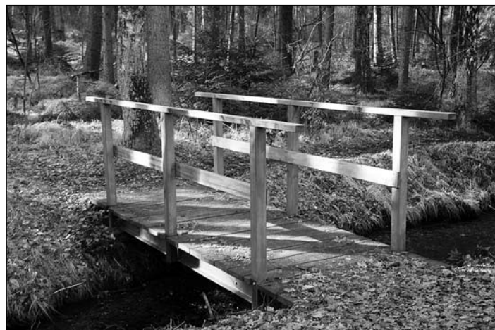
neue Brücke am Steinteich

Zwei Holzbrücken im Massenei-Wald waren im Laufe der Zeit durch Witterungseinfluss verfault und morsch geworden, so dass sie nicht mehr begehbar waren. Die Mitarbeiter des Technischen Dienstes der Stadtverwaltung ersetzten diese daher. Aus größtenteils vorhandenem Mate-