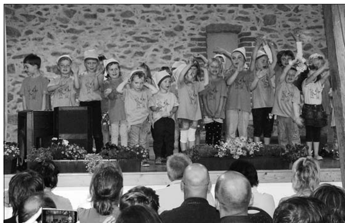
Programm der Kinder

Nach langem Kampf und mit großer Unterstützung von Elternrat, Eltern und Sponsoren gelang uns im Jahr 2011 der Bau und die Gestaltung unseres Spielplatzes.