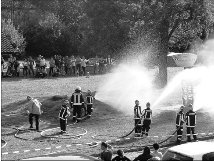
Schauvorführung der Jugendfeuerwehr

Mit dem Hähne-Wett-Krähen begann der Tag. Danach lief das Kirmes-Sonntagsprogramm auf Hochtouren. Adlerschießen, Entenrennen auf der Röder bei dem die Enten ruck-zuck ausverkauft waren, Gummistie-