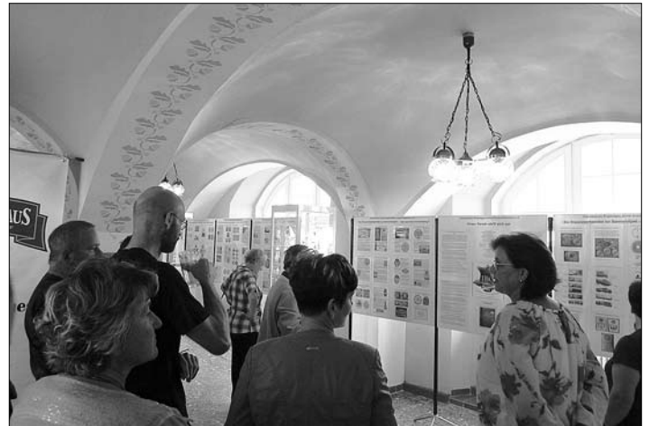
... war ein Anziehungspunkt.

besuchen. Ein großer Dank gilt dabei dem Freundeskreis Brauereigeschichte Dresden/Ostsachsen e.V., der Böhmisches Brauhaus GmbH und den Einwohnern aus dem Rödertal, welche durch ihre Leihgaben eine wirklich interessante Ausstellung rund um das Bier, der Bierwerbung, der Geschichte der Brauerei Großröhrsdorf und der Brauerei Bretinig den Besuchern näher bringen konnten.