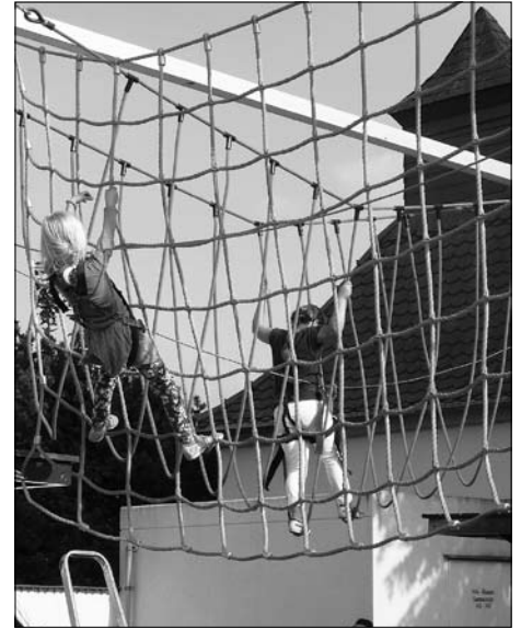
Neu in diesem Jahr - der Kinderseilgarten