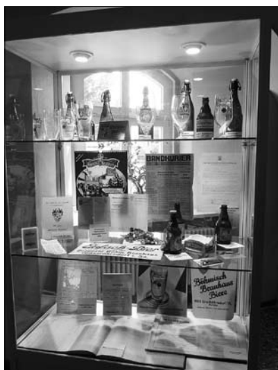
Die Ausstellung „PROST – 500 Jahre Reinheitsgebot“ ...