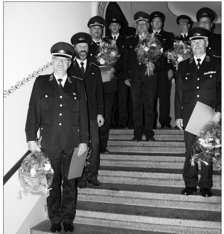
Ausgeschiedene und neu gewählte Mitglieder der Wehrleitung