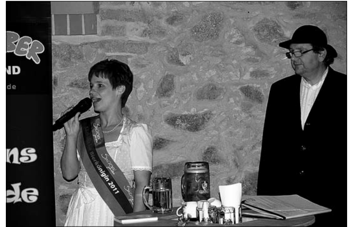
Bierkönigin und Bier-ologe

sche Miteinander konnte in Bretnig-Hauswalde sich ein Volksfest entwickeln, welches seinen Namen mit Recht tragen darf!