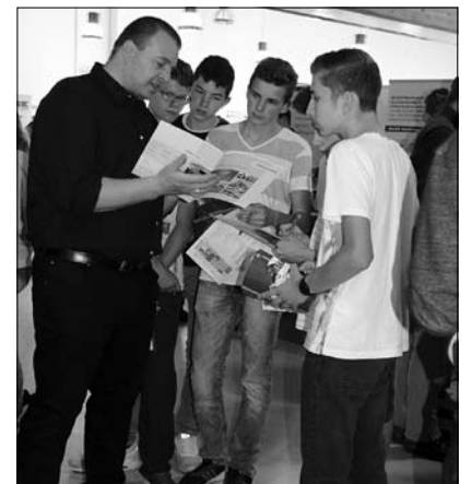
Schüler informieren sich gezielt beim Unternehmer nach einem Ausbildungsberuf

den und Fragen zu stellen. Erstmals mit einer Broschüre konnten sich die Oberschüler und Gymnasiasten bereits im Vorfeld gezielt auf diese Veranstaltung vorbereiten. So kamen viele interessante und informative Gespräche zwischen den Schülern und Unternehmern zustande, in denen vielleicht schon ein konkreter Ausbildungswunsch sich entwickelte. Von Hotelfachmann bzw. -frau, über Gleisbauer, Mediengestalter/in, Altenpfleger/in bis Polizeivollzugsbeamte(r) ist alles möglich.