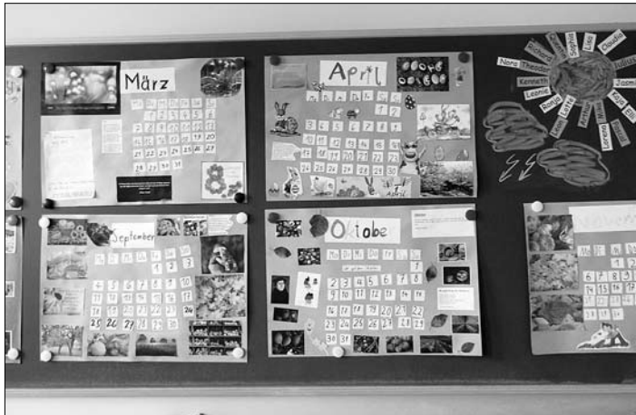
Andere Klassen stellten ihre selbst hergestellten Kalender aus. In weiteren Räumen wurden stolz die ersten Versuche der deutschen

So äußerten sich auch viele Besucher, die das Angebot der Grundschule nutzten, sich an diesem Tag in den Räumen vom Keller bis zum Dach umzuschauen. Viele ältere Gäste konnten ihr ehemaliges Klassenzimmer nicht mehr finden, da vieles im Haus durch die Baumaßnahmen verändert wurde. Moderne Technik ist eingezogen und konnte in Funktion angeschaut werden. Anregende Gespräche fanden über das Thema „Schule früher und heute“ statt. Dazu konnte man Unterrichtsmaterialien aus vergangener und aktueller Zeit genau unter die Lupe nehmen. Natürlich präsentierten die SchülerInnen in ihren Klassenzimmern, was sie in der letzten Zeit in der Schule bearbeitet haben. Bei den Erstklässlern konnte man in die sauber geführten Hefte schauen und erste kleine geschriebene Briefe bewundern.