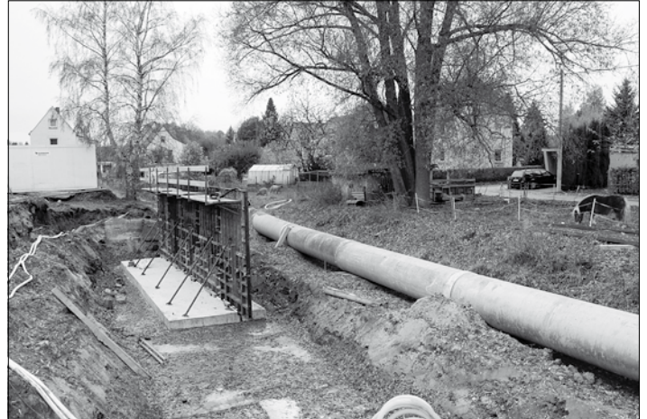
Die erste Verschalung für das Gießen der Mauer steht gegenüber Isoliererzeugnisse.

Schwieriger gestalten sich die Arbeiten an der Stützwand in Höhe der Isoliererzeugnisse Großröhrsdorf GmbH. Im Zuge der Schachtarbeiten für das Stützwandfundament wurde eine wasserführende Schicht angeschnitten. Die hervortretenden Wassermengen müssen mit dem aufwendigen Verfahren einer geschlossenen Wasserhaltung gefasst werden.