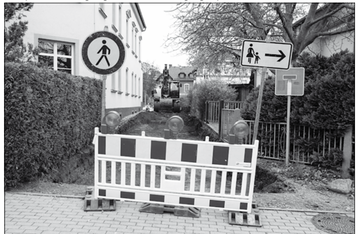
Rückbau der vorhandenen Befestigung auf der Poststraße

Die Firma Frauenrath Bauunternehmen GmbH setzt seit Anfang November die Poststraße wieder instand. Die Straße ist für den Bauzeitraum komplett für Fußgänger und Fahrzeuge gesperrt.