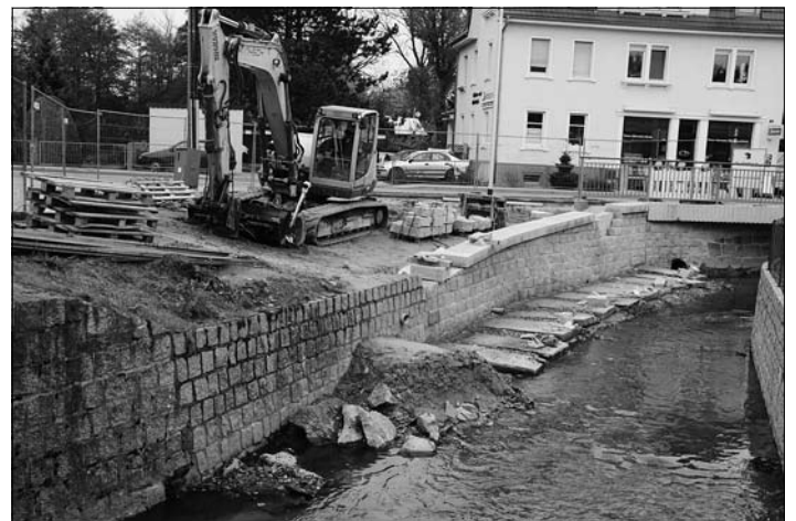
Die Rödermauer im Bereich Radeberger Straße 97 wird mit Granit verblendet.

Somit konnten die Arbeiten zeitnah am 1. September beginnen. Zur Schaffung der notwendigen Baufreiheit musste zuerst die Röder an den betroffenen Stellen umgeleitet werden. Danach konnte mit dem Rückbau der beschädigten Stützwände begonnen werden.