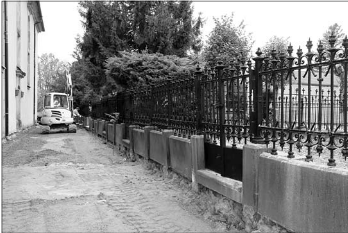
Der Weg entlang der Kirche kann gepflastert werden.

Im Abschnitt Kirchweg (Weg im Friedhof nördlich der Kirche) verlegte das Unternehmen den Regenwasserkanal neu. Dabei wurden die Arbeiten durch nicht bekannte unterirdische Bauwerke, Kanäle und Kabel erschwert. Da die Arbeiten am Regenwasserkanal nun abgeschlossen sind, kann mit den Pflasterarbeiten für den Gehweg begonnen werden. Sofern die Witterung es zulässt, soll das Verlegen bis Ende November beendet sein, so dass dann der Weg wieder für den Fußgängerverkehr freigegeben werden kann.