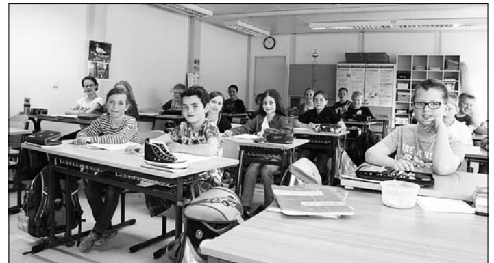
Die Schüler der Klasse 4 fühlen sich wohl in den neuen Unterrichtsräumen.