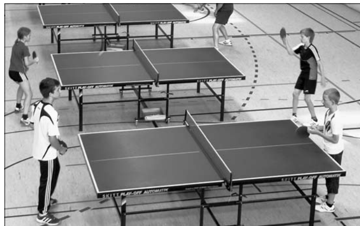
Heiß umkämpfte Spiele beim TT-Turnier im Vorjahr