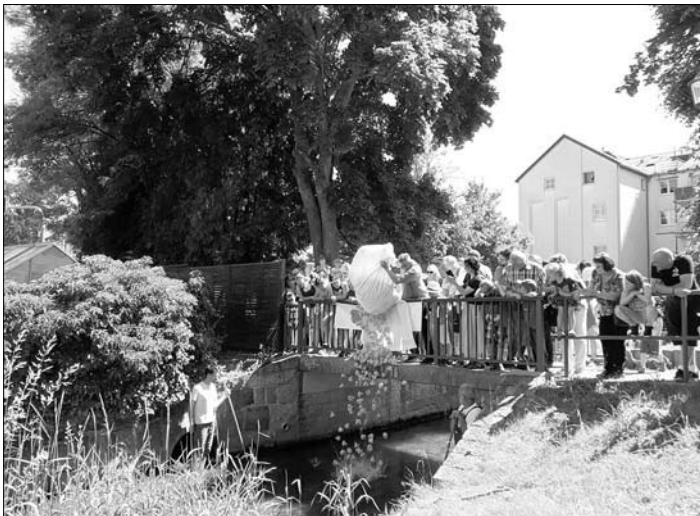
Start des Entenrennens

Gut erholt vom Vortag versammelten sich die Entenfans am Sonntagvormittag zum traditionellen „Entenrennen“. Eng gedrängt am Geländer entlang der Röder feuerten sie die kleinen gelben Enten an. Manchmal