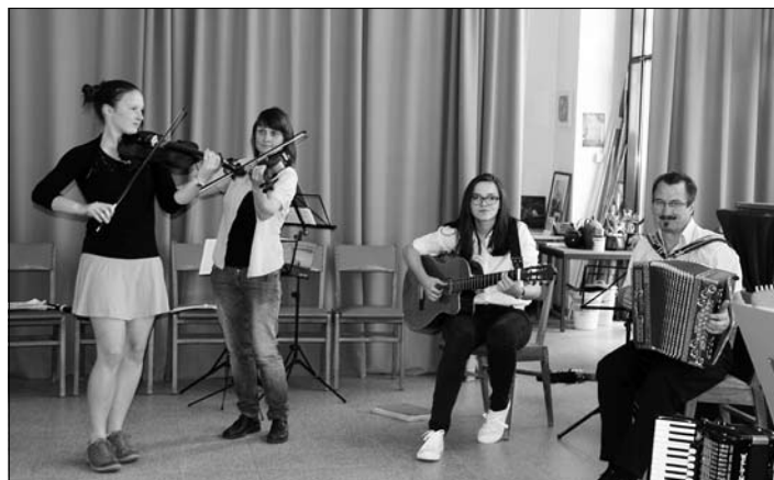
Die Musikschule Lorek öffnete ihre Tore.

Danach hieß es selbst kreativ werden beim Gipsfigurenmalen oder Hüte gestalten, oder man lauschte gespannt dem Auftritt des Akkordeonorchesters „Harmony Dreams“.