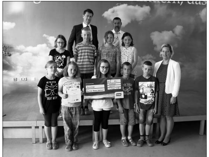
Die Klasse 3a der Grundschule erreicht den 2. Platz und erhält damit ein Preisgeld von 75 Euro.

den Wettbewerb erstellten Wissenstest. Diesen haben die dritten Klassen der Praßerschule mit dem 1., 2. und 4. Platz sehr erfolgreich abgeschlossen.