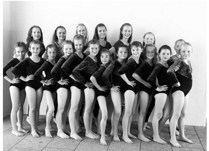
Die Tanzgruppe „Crazy Cats“

Auch am Freitag war die Resonanz bei den Großröhrsdorfern nicht so groß. Woran lag es? Sind alle von der Woche geschafft und entgegen vieler Wünsche nach drei Tagen Einigkeitsfest wird der Freitagabend dann doch lieber zu Hause verbracht? Schade, denn es macht viel Arbeit so ein Fest zu planen, zu organisieren und durchzuführen.