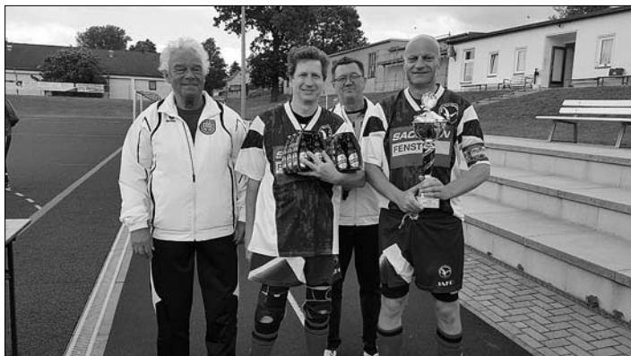
1. Platz: SSV Germania 92 Bischofswerda