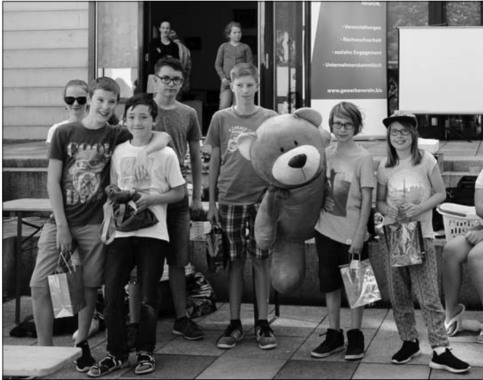
Die Sieger des Water Bottle Flip Wettbewerbs

seine Türen. Insbesondere die Sonderausstellung „Gut behütet!“ zählte viele Besucher.