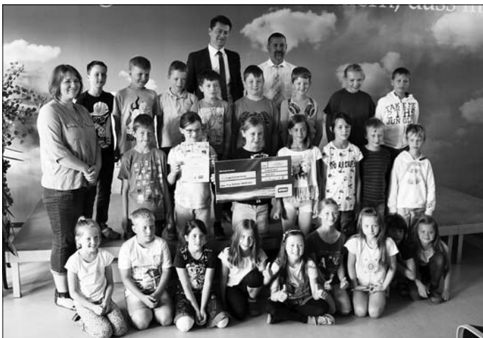
Die Klasse 3b belegt den 1. Platz und darf sich über ein Preisgeld von 125 Euro für die Klassenkasse freuen.

Die Schüler der dritten Klassen aus Arnsdorf, Frankenthal, Großharthau, Großröhrsdorf, Pulsnitz und Wachau setzten sich im Unterricht anhand von verschiedenen Bildungsmodulen mit dem Thema „Erneuerbare Energien“ auseinander. Im Anschluss beantworteten sie einen eigens für