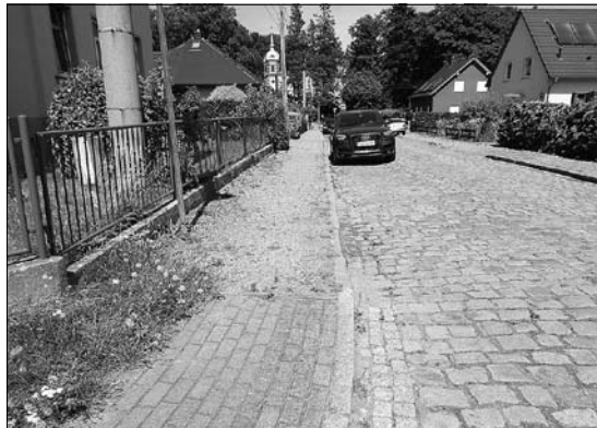
Brauereistraße (zwischen Bahnhof- und Großmannstraße)