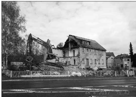
Klinkenplatz 2 - Abriss und Freiflächengestaltung