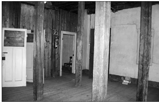
Dachgeschossausbau im Rathaus (Umnutzung für Büro)