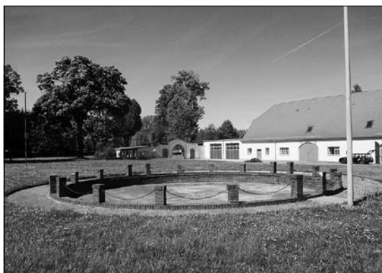
Hofepark, 3. BA Platzgestaltung