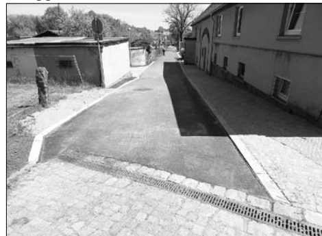
Bahnhofstraße - hinter dem Lehngut

Stadtkonto eingegangen - das sind bereits 89% der geplanten Summe. Von 260 betroffenen Grundstückseigentümern wurden in 251 Fällen Ab-