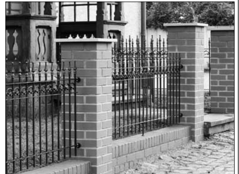
Einfriedung Poststraße 1

Homepage der Stadt unter http://www.grossroehrsdorf.de/web/unserestadt/staedtebauforderung/index.php über alle Angelegenheiten des