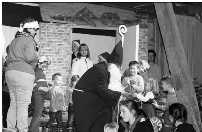
Der Nikolaus hat für jedes Kind etwas mitgebracht.