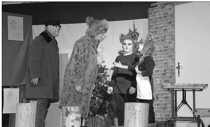
Märchenaufführung - Das Katzenhaus

Dieses Jahr hatte sich der Revueclub Bretinig-Hauswalde e.V. das zweite Märchen „Das Katzenhaus“ von Samuil Marschak vorgenommen.