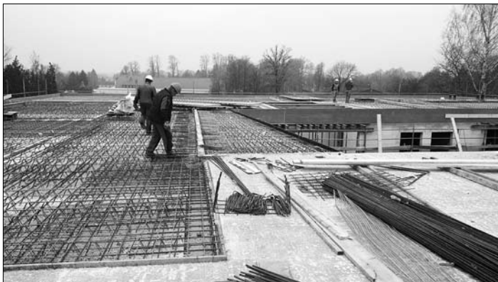
November 2017: Das Dach ist fast fertig.

ist der Bau stetig vorangegangen. Der Rohbau konnte noch im Jahr 2018 fertiggestellt werden. Dach und Fenster ermöglichen nun über den