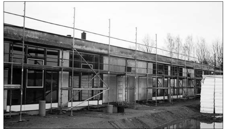
Dezember 2017: Die Fenster sind drin, nun kann der Innenausbau beginnen.

Seit der ersten Januarwoche verlegt die HSKG moderne Haustechnik aus Kamenz nun Rohre für Heizung und Sanitär im Gebäude. Auch die Elektroarbeiten werden derzeit realisiert, so dass im Februar der Innenputz verwirklicht werden kann. Die Beauftragung von Trockenbau und Innenputz soll im Stadtrat am 30. Januar erfolgen. Parallel dazu laufen für die sich anschließenden Arbeiten wie die Aufbringung des Estrichs und den Tischlerarbeiten die Ausschreibungen im Februar.