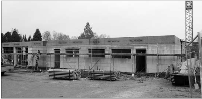
November 2017: Der Rohbau ist fertig.