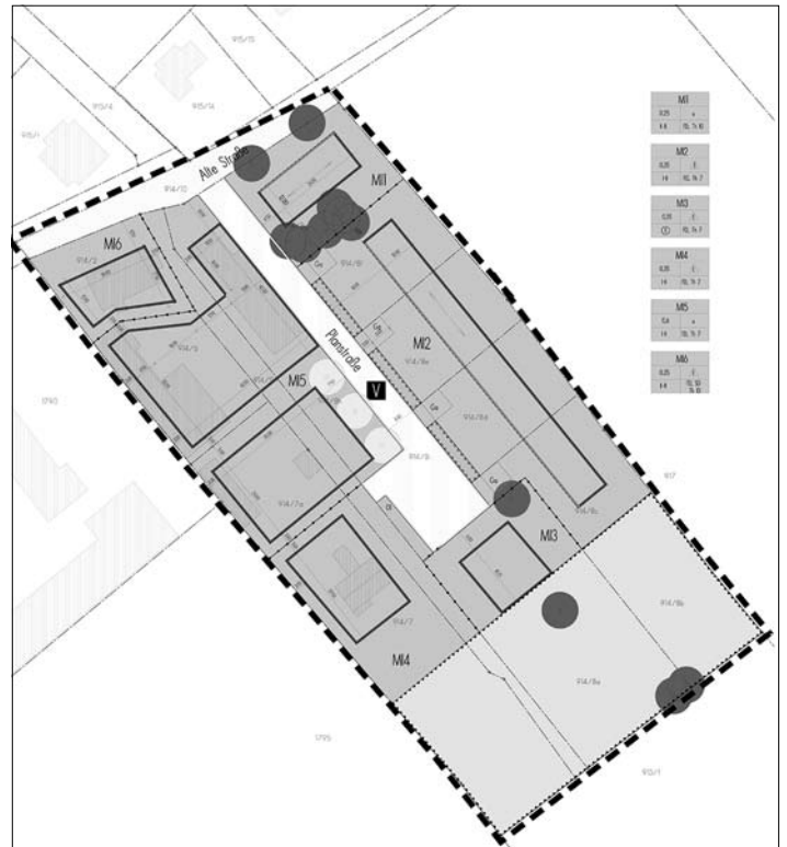
Vorentwurf des Bebauungsplanes „Alte Straße – Bereich Praßerstraße“