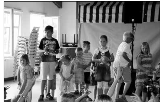
Die Gewinner des Entenrennens