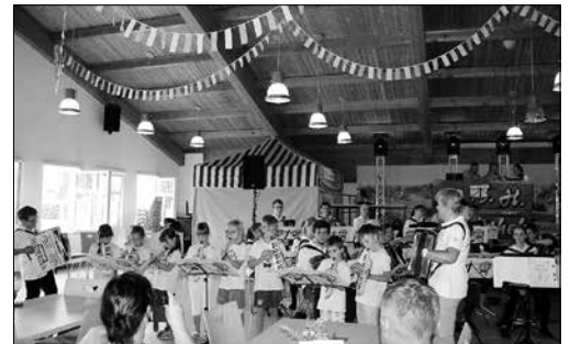
Die Jüngsten der Musikschule Fröhlich