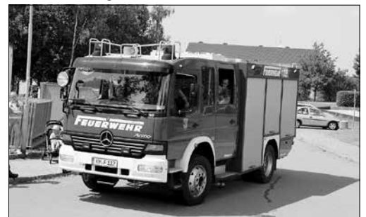
Rundfahrten der FF