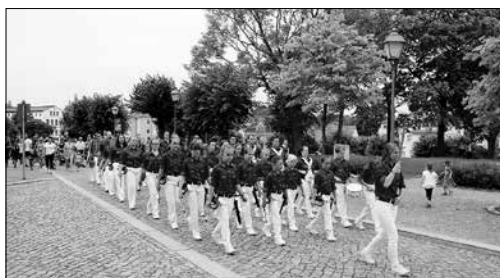
Der Spielmanszug begleitete musikalisch den Weg vom Rathaus zur Festwiese.

Am Sonntag ging es wie jedes Jahr mit dem Entenrennen los. Es ist schon immer toll anzusehen, wenn 600 Plaste- und einige lebendige Enten die Röder entlangschwimmen.