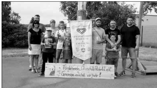
Die Gewinner des Mehrkamps, organisiert vom Gewerbeverein Rödertal u. Umgebung und dem Förderverein Oberschule

Es konnten wieder Gipsfiguren bemalt werden und am Enso-Mobil gab es Basteleien und Spiele.