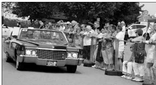
Vor allem die älteren Cabrios begeisterten die Zuschauer.

Am Nachmittag fanden zunächst die Fußballspiele der 2. und 1. Männermannschaft des SC 1911 e. V. statt. Zwischen den beiden Spielen empfing die erste Mannschaft aus den Händen der Vertreter des Westlausitzer Fußballverbandes den Meisterpokal des Landkreises Bautzen.