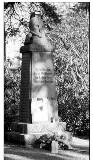
Schriftzug und die Namen der Gefallenen sind nun wieder deutlich am Denkmal in Hauswalde lesbar.