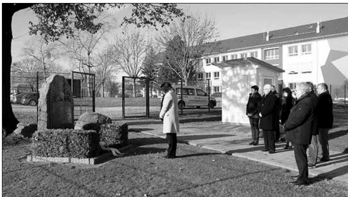
Kranzniederlegung am Denkmal für die gefallenen Turner im 1. Weltkrieg

Zum Gedenken an die Kriegstoten und an die Opfer der Gewaltherrschaft aller Nationen legten auch zum Volkstrauertag am 18. November Bürgermeisterin, Ortsvorsteher und Vertreter des Stadtrates, des Ortschaftsrates sowie der Stadtverwaltung an insgesamt neun Kriegsdenkmälern Kränze nieder.