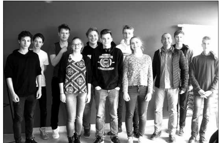
Mitglieder des Großröhrsdorfer Debattier-Klubs beim Regionalverbundwettbewerb im Gymnasium Coswig.

Die Schülerinnen und Schüler vom Sauerbruch-Gymnasium Großröhrsdorf werden im GTA „Debattier-Klub“ seit nunmehr 13 Jahren auf „Jugend debattiert“ erfolgreich vorbereitet. Nach Unterrichtsschluss verbessern sie bei wöchentlichen Trainingseinheiten ihre Ausdrucks- und Gesprächsfähigkeit und stärken ihre Sachkenntnis und Überzeugungskraft. In anschließenden Wettbewerben gilt es, die neu erworbenen Kompetenzen unter fairen Regeln umzusetzen.