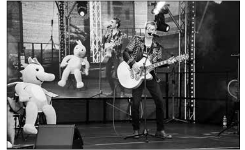
Peter Maffay-Double begeistert im Festzelt.