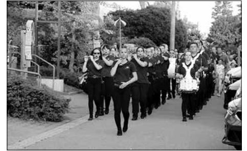
3. Lampionumzug mit dem Spielmannszug Kleinröhrsdorf