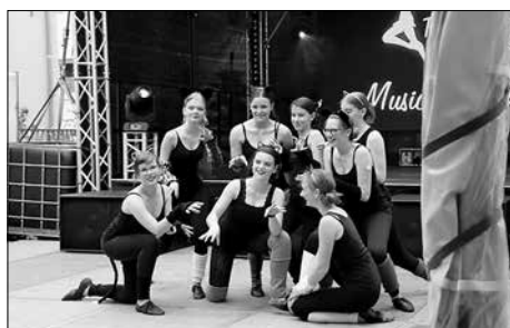
Musicalfeeling mit der Tanz- und Theaterwerkstatt aus Pulsnitz