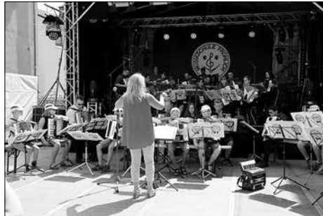
Auftritt des Akkordeonorchesters Harmony Dreams