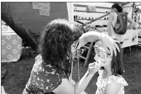
Es gab unzählige Angebote für die Jüngsten, wie das Kinderschminken bei der Kita „Erfinderkinder“.

Die Bürgermeisterin und die Organisatoren des Stadtfestes bedanken sich bei allen Teilnehmern, die solch ein buntes Programm ermöglicht haben und auch bei den vielen Besuchern des Stadtfestes.