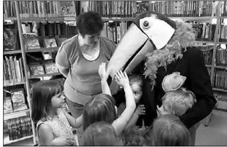
Ein lebensgroßer Papagei, ein Dinosaurier und eine Maus entschlüpfen am Freitag in der Stadtbibliothek den Büchern.