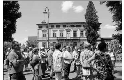
Rund 100 Teilnehmer nahmen am Villenspaziergang teil.

Die Bürgermeisterin und die Organisatoren des Stadtfestes bedanken sich bei allen Teilnehmern, die solch ein buntes Programm ermöglicht haben und auch bei den vielen Besuchern des Stadtfestes.