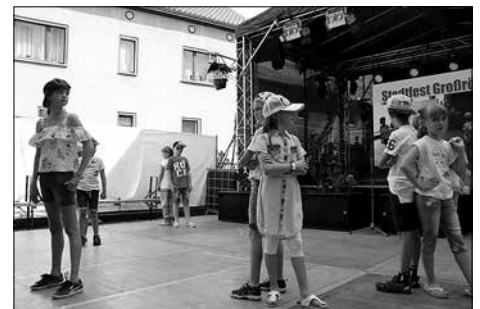
Peppige Kleidung gab es bei einer Modenschau zu bestaunen.