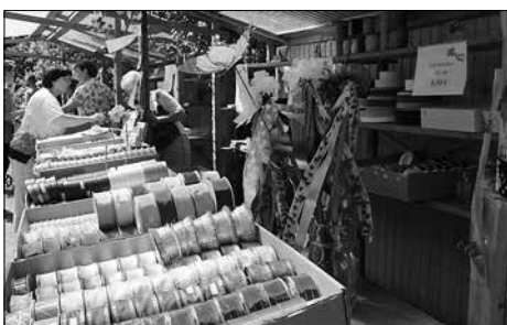
Bändermarkt im Innenhof der Kulturfabrik