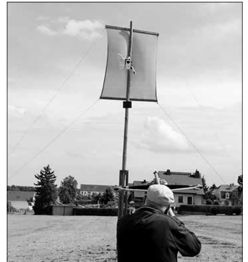
Otto Plünzig wird in diesem Jahr Schützenkönig beim Adlerschießen.