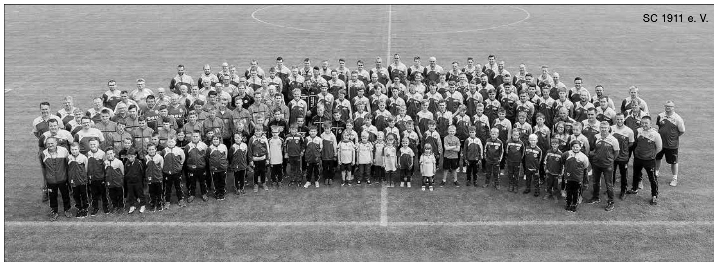
SC 1911 e. V.

„DIE JUNGEN WILDEN“ wie ich sie gerne nannte, fanden nicht gleich