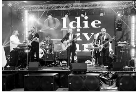
Oldie Live Band präsentiert durch den SC 1911 e.V. rockte am Samstagabend das Festzelt.