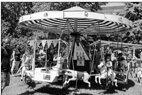
Im Innenhof der Kulturfabrik drehte sich das Kinderkarussell des Kleingartenvereins unaufhörlich.