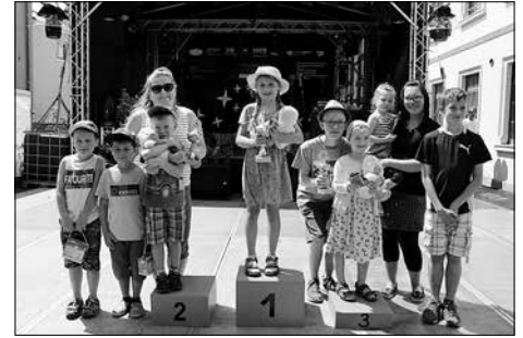
Die Gewinner des Entenrennens