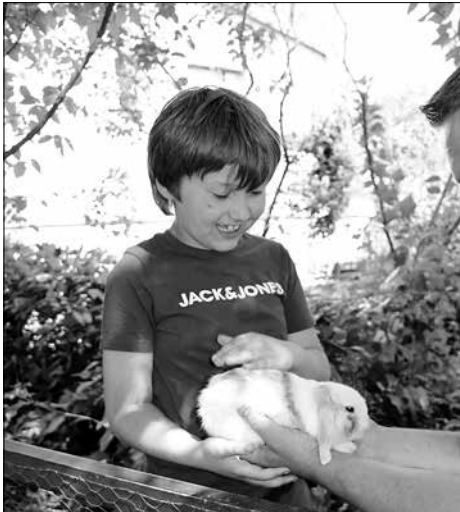
Rassekaninchen und -geflügel gab es zum Anfassen im Innenhof der Kulturfabrik.