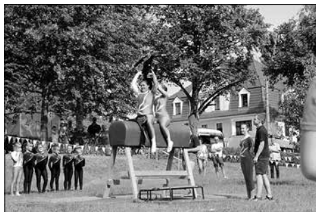
Der Pferdehof Gina´s Heimat zeigte eine Voltigiervorführung.