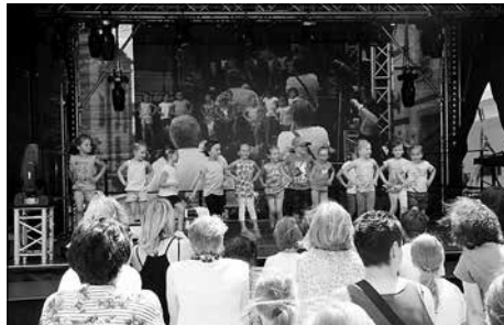
Die Zumba-Kids zeigen auf der Bühne ihr sportliches Können.