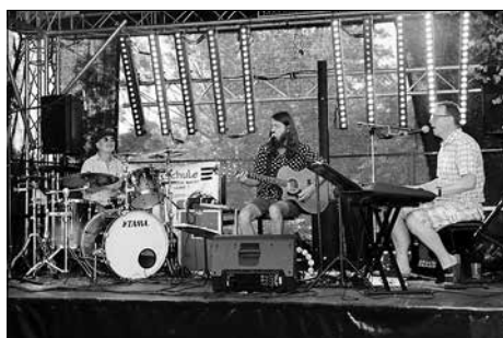
Live-Musik mit dem Trio der Vintage Rock Combo