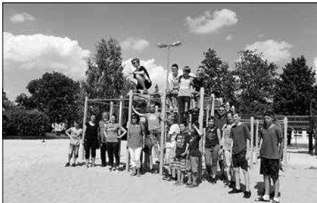
Einweihung des Parkour-Elements durch die Jugendgruppe „Projekt P“ am Spielplatz der Walther-Rathenau-Straße