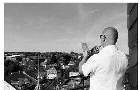
Abschluss des Stadtfestes mit Turmbläser