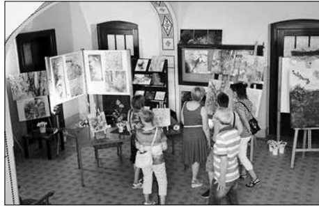
Das Rathaus wird zur Kunstgalerie.