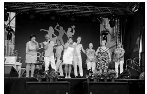
Mehr als 100 Talente aus dem Rödertal beteiligten sich an der Aufführung des Revue Clubs Hauswalde.