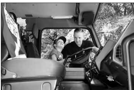
Mit einem Feuerwehrauto ging es am Sonntag-nachmittag durch die Stadt.