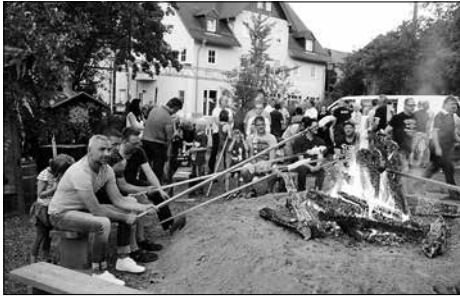
Kinderpark des Gewerbevereins Rödertal und Umgegend e.V. mit Lagerfeuer