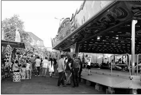
Schaustellerpark auf dem Parkplatz am Rathaus