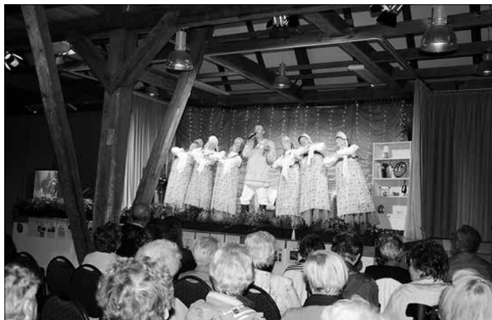
Musikalischer Rückblick auf 20 Jahre Revue zur Bretniger Kirmes