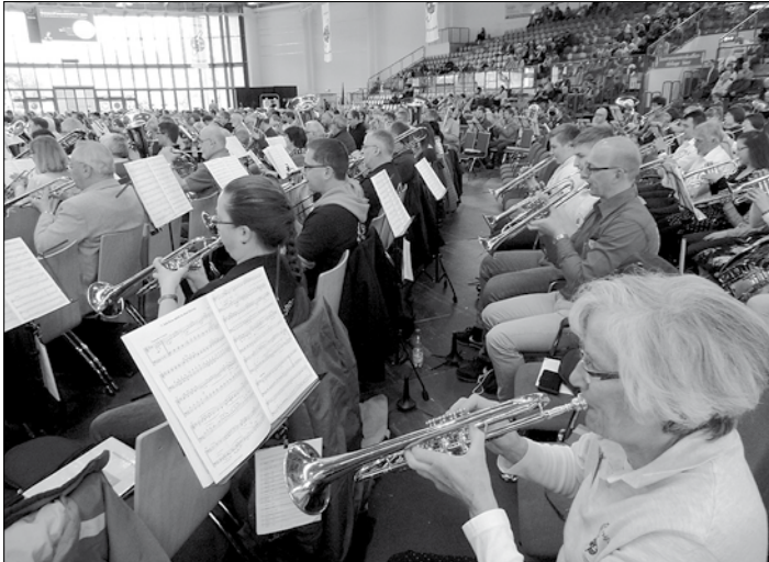
3.-5. Mai 2019 Neubrandenburg Sport-Forum

Diese sahen auch gut aus beim Auftritt im Festzelt in Großröhrsdorf zum Einigkeitsfest und zum Adventsfest in der Bretziger Hofescheune.