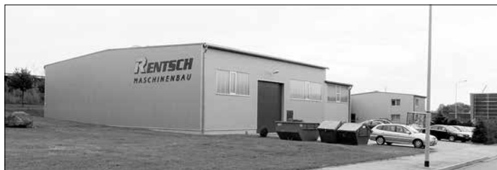
Erweiterungsbau Rentsch Maschinenbau