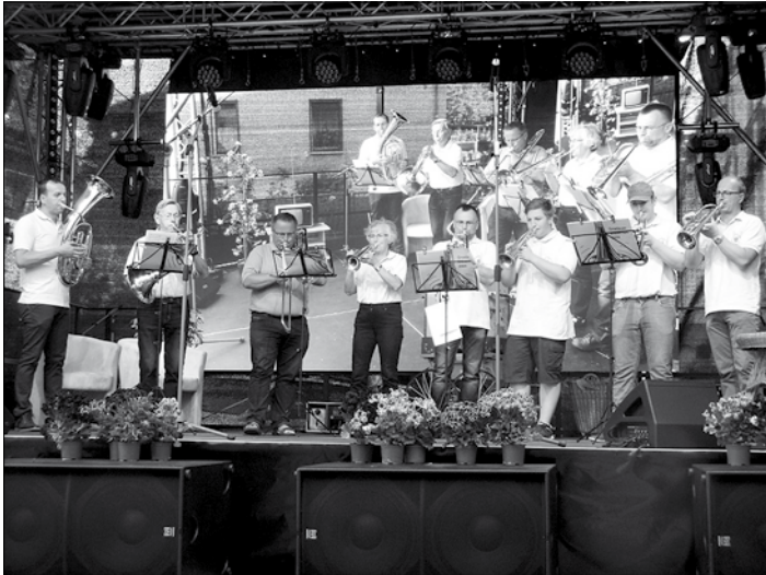
23. Juni 2019 Einigkeitsfest Großröhrsdorf im Festzelt

Diese sahen auch gut aus beim Auftritt im Festzelt in Großröhrsdorf zum Einigkeitsfest und zum Adventsfest in der Bretziger Hofescheune.