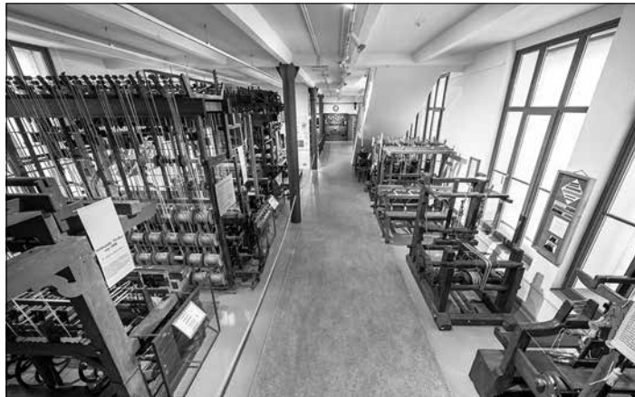
Blick ins Technische Museum der Bandweberei

Heimlich, still und leise hat Bernd Franke an einem Buch gearbeitet, welches die Vielfalt und Bedeutung der Bandweberei in Großröhrsdorf und Umgebung darstellen soll. Es ist ihm ein Meisterwerk geglückt, der Umfang ist unglaublich. Pünktlich zum Start ins Jahr der Industriekultur 2020 in Sachsen ist dieses Buch erschienen.