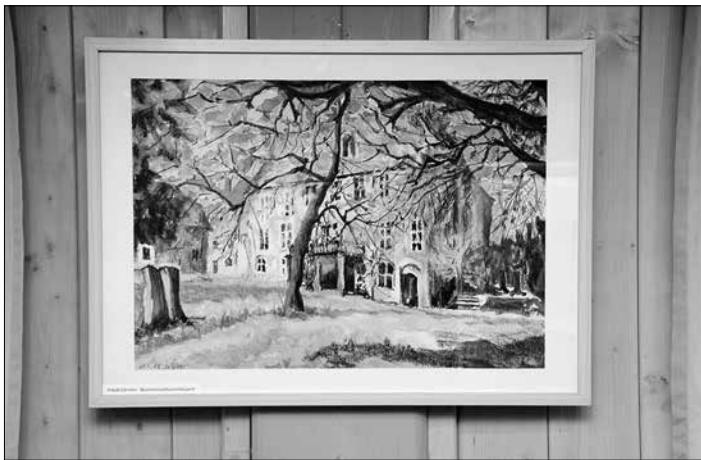
Gezeigte Werke im Heimatmuseum (Bilder links und rechts)