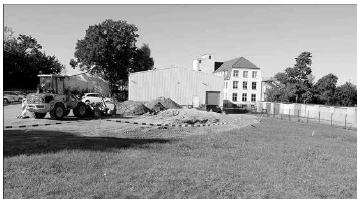
01.09.2020 - Baubeginn für die neue 700 qm große Lagerhalle der SHZ GmbH

Und auch für die SHZ-Mitarbeiter ergeben sich durch die neue Lagerhalle viele Vorteile. Die Arbeitsprozesse beim Ein- und Auslagern werden deutlich einfacher. Zudem sorgt die Verdoppelung der Lagerfläche für eine bessere Übersichtlichkeit.