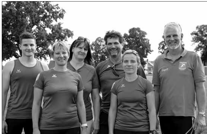
v.l.n.r. Trainer und Übungsleiter der SG Großröhrsdorf Sektion Leichtathletik

Das werden die jungen Sportlerinnen und Sportler des Vereins SG Großröhrsdorf Abteilung Leichtathletik häufig gefragt. Auch bei Sächsischen Landesmeisterschaften, Mitteldeutschen und Deutschen Meisterschaften starten Sportler der Kleinstadt neben den Athletinnen und Athleten der größeren Vereine und Sportschulen aus Leipzig, Chemnitz und Dresden. Besonders stolz und froh sind sie, wenn sie in ihren blauen Trikots auf das Podest steigen dürfen und dabei ihre Heimatregion würdig vertreten. Dies ist vor allem den ehrenamtlichen Trainer*innen und den Übungsleitern der Sektion Leichtathletik zu verdanken. Sie leisten eine Arbeit, die Hochachtung verdient.