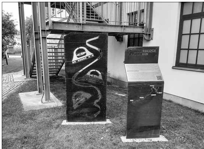
Aufsteller am Technischen Museum der Bandweberei

Die Route ist das Ergebnis der Zusammenarbeit von Bürgern aus den beiden LEADER-Regionen Bautzener Oberland und Westlausitz in der Zeit von 2017 bis 2019. Unter dem Motto „Die Fabrik im Dorf lassen!“ diskutierten interessierte Bürger in gemeinsamen Arbeitstreffen den Routenverlauf und legten inhaltliche Schwerpunkte fest.