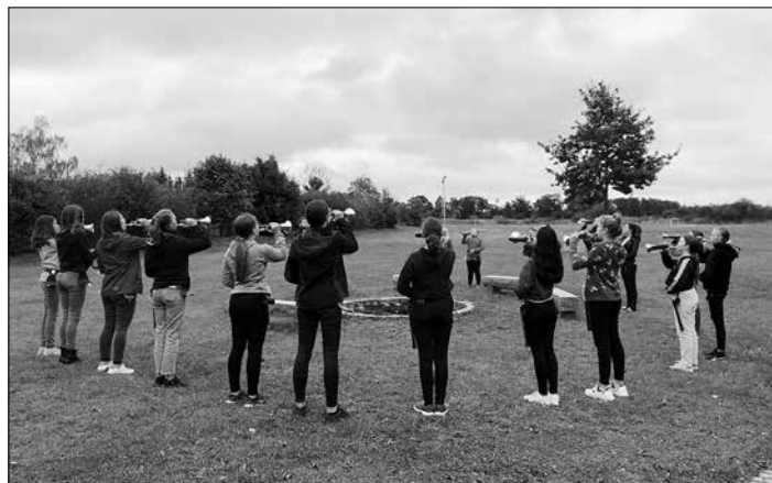
Hornübungsstunde mit dem Nachwuchszug