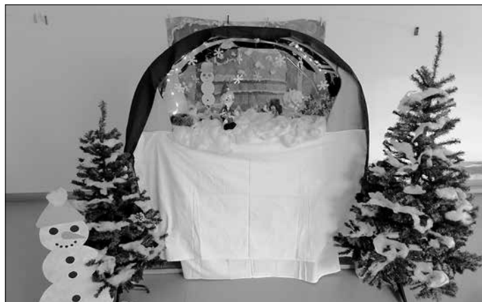
Kinderkino für die Erfinderkinder

Zuhause konnten die Kinder eine Pom Pom Kanone herstellen und gestalten, an dem Faschings-Tag gleich mitbringen und mit anderen Kindern gemeinsam ausprobieren. Ja, wir Erzieherinnen können aktuell unsere Kreativität und Fantasie ganz schön zum Überkochen bringen.