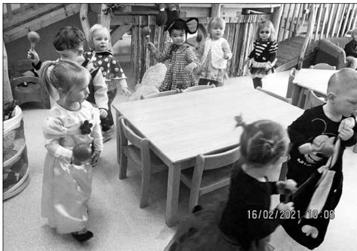
Fasching in der Kinderkrippe

Auf ein Neues! Nach dem 2. Lockdown durften wir am 15.02.2021 unsere Kita Erfinderkinder wieder öffnen. Vom 14.12.2020 bis zum 14.02.2021 mussten unsere Kinder wieder einmal zuhause bleiben- es gab nur eine Notbetreuung für systemrelevante Berufsgruppen. Ungewiss starteten wir im Januar in das neue Jahr. Sonst zum Jahreswechsel euphorisch, waren wir dieses Mal eher besorgt, was uns das neue Jahr wohl bringen wird. Pläne, Vorhaben, Events, alles eingefroren. Warten, Ausharren, Umplanen und neue Strukturen finden steht nun auf unserer Agenda. Uns anzupassen, an die Regelungen und Bestimmungen, können wir mittlerweile ganz gut. Nur das Akzeptieren fällt uns schwer. Seien wir doch ehrlich, wir sind alle Corona-Müde. Kinder, Eltern und auch Erzieherinnen wollen nur eins zurück: Normalität und Sicherheit. Doch wann es soweit ist und ob wir jemals wieder in unseren gewohnten Kita-Alltag zurückkehren können, steht aktuell in den Sternen. Also machen wir weiter, so optimistisch, wie es nur geht und so realistisch,