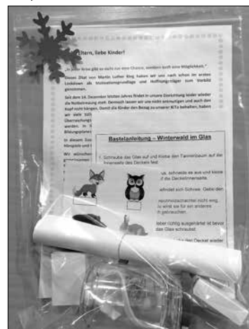
Erste von zwei Überraschungstüten

Unsere Erfinderkinder haben in diese zweite Kita-Öffnung sehr gut reagiert. Das große Chaos blieb aus, nur einzelne Kinder brauchten und brauchen mehr Zuwendung als andere. Wir haben bewusst auf ein sanftes Ankommen gesetzt und dafür auf die große Faschingsparty am 2. Tag verzichtet. Wo sonst getobt, getanzt und wild gefeiert wurde, ging es in diesem Jahr schon fast besinnlich zu. Nicht schlimm, haben doch die Kinder das Weihnachtsfest in der Kita im letzten Jahr durch die Schließung verpasst. Es durfte sich natürlich auch verkleidet werden. Wir haben lediglich auf das Kinderschminken verzichtet und stattdessen Kostümbilder bunt angemalt. Auch ein Buffet gab es nicht, dafür hat sich jeder eine eigene Popcornröhre hergestellt, denn statt wilder Kinderdisco gab es ein gemeinsames Kinderkino, natürlich nach Gruppen getrennt. Eine Polonaise muss auch nicht zwingend kreuz und quer durch die Kita verlaufen, im eigenen Gruppenzimmer mal um, über und unter dem Tisch lang, ist auch ganz lustig. Im Vorfeld der Kita-Öffnung hatten die Kinder, welche Zuhause betreut wurden, die Möglichkeit, sich in der Kita einmal in der Woche eine Überraschungstüte abzuholen. Diese war randvoll mit Aktivitäten, Basteleien, Liedern und Fingerspielen entsprechend der Jahreszeit. So gab es zum Beispiel auch eine Bastelei für das bevorstehende Fasching. (→ Seite 2)