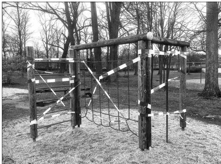
Gesperrtes Spielgerät im Hofepark in Bretzig

Betroffen davon ist der Spielplatz „Am Hofepark“. Hier musste zunächst die Kletteranlage gesperrt werden. Die Mitarbeiter der Technischen Dienste werden den Spielplatz zeitnah wieder instand setzen.