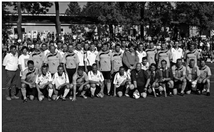
Einweihung des Kunstrasenplatzes Bretnig

2011 fand die Einweihung des Kunstrasenplatzes statt. Das Spielen auf dem Schotter/Steinmehl-Platz hatte ein Ende. Der FSV Bretnig-Hauswalde konnte jetzt beste Bedingungen für den Wettspielbetrieb bieten. Begeistert waren natürlich die vielen Nachwuchsspieler. Auch Kleinfeldhandballspiele können stattfinden.