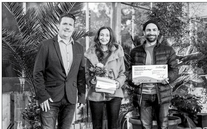
Der 2. Platz in der Kategorie „Kinder und Jugend“ ging an den Naturbad Buschmühle e.V.

In der Kategorie „Kinder und Jugendliche“ wurde „TanzART – Atelier für Tanz, Bewegung & Kunst“ für das Projekt „WENDEpunkt – Stoff für Geschichten“, einem Tanzprojekt, welches mit Jugendlichen aus der Region umgesetzt wurde, mit dem ersten Platz geehrt. Die weiteren Platzierungen gingen an den Verein Naturbad Buschmühle für das Projekt „Schwimmpaten gesucht“ und an den Wunder Land e.V. für das Projekt „Alternative Freizeitangebote“. Den Sonderpreis erhielt eine Initiative aus Rammenau für das Filmprojekt „Die wunderbare Welt der Rammenauer Kinder“.