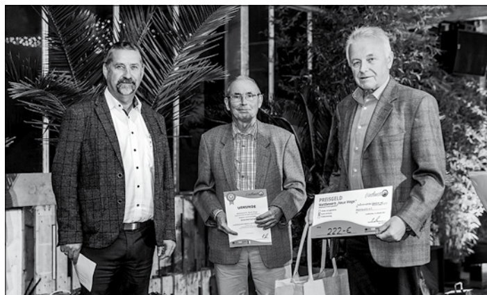
Auch der Großröhrsdorfer Industrie- und Bandmuseum e.V. freute sich über eine Anerkennung seines Engagements zur Bewahrung des industriellen Kulturerbes in der Rubrik „Kunst und Kultur“

und online gestreamt. Platz 2 und 3 gingen an die AG Schiebocker Tage für die Projekte „Schiebocker Tage@home“ und „Schiebock macht auf“ sowie den Mosaika e.V. für das Projekt „Digitaler Adventskalender“.