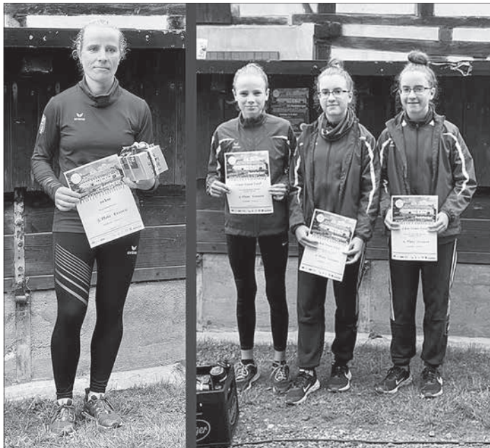
Hüttertallauf