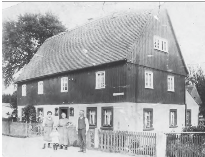
Haus an der Radeberger Straße 131

damals genannt, im Unterschied zu den vergangenen Jahrgängen, die zu Ostern eingeschult worden waren - war aber schon vom Krieg beeinflusst; denn die Hauptschule (jetzt Praßerschule) war bereits zum Lazarett der Wehrmacht umfunktioniert worden. Für die Klasse aus der Niederstadt (wir waren drei Klassen des Geburtsjahrganges 1935/36) war der „Ratskeller“ der Ausweichstandort und blieb es bis zur Einstellung des Unterrichts Mitte April 1945.“