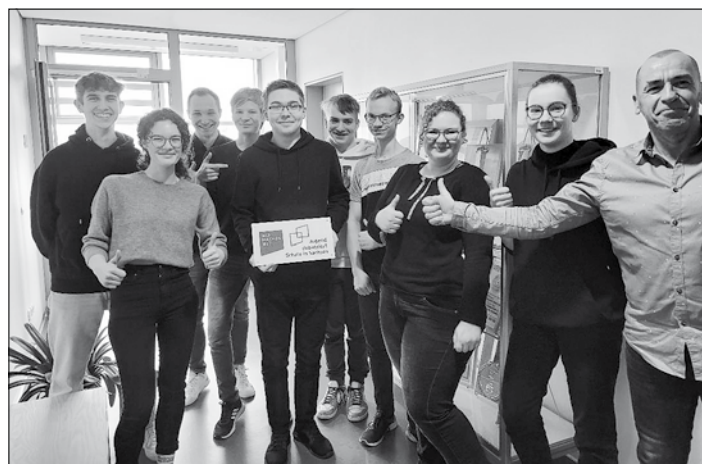
Mitglieder des Debattier-Klubs Großröhrsdorf 2023