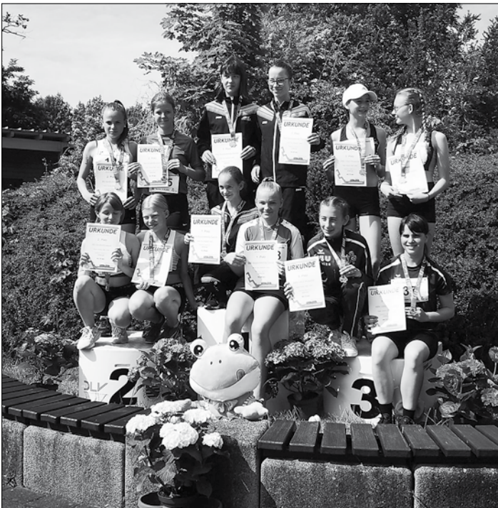
2. Platz der 4x75 m-Staffel der Mädchen U14

Bei den etwas Größeren (8 bis 11), trainiert von Katrin und Erik Garten, konnte Milan Jenchen (M9) im 50 m Sprint, im Ballwurf und über die 600 m jeweils den 3. Platz belegen. In der Trainingsgruppe (9 bis 12) trainiert von Ingolf Guhr, holte sich Nico Schulze (M10) mit hervorragenden Läufen Gold im 50 m Sprint sowie im 60 m-Hürdenlauf.