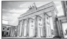
Vertrieb durch Technisat