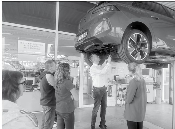
Blick unter ein E-Auto beim Autohaus Winter

Die Führungen durch die Unternehmen waren kostenfrei und dauerten meist etwa eine Stunde. Ein Busshuttle stand zur Verfügung, um sicher und reibungslos von einer Station zur nächsten zu kommen. Insgesamt nahmen rund 60 interessierte Bürgerinnen und Bürger das Angebot in Anspruch und ließen sich, teilweise von der Geschäftsleitung selbst, durch die Unternehmen führen und keine Frage blieb unbeantwortet. Auch für die Unternehmer war es eine Premiere, auf diese Weise Blicke in ihre Unternehmen zu gewähren. Und sie hatten sich so einiges einfallen lassen. Neben kleinen Snacks warteten alle mit vielen interessanten Informationen zur Herstellung und ihrer Produkte auf. Mancher Gast war erstaunt, in welchen Erzeugnissen letztendlich Teile aus Großröhrsdorf zu finden sind.