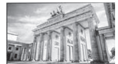
Vertrieb durch Technisat