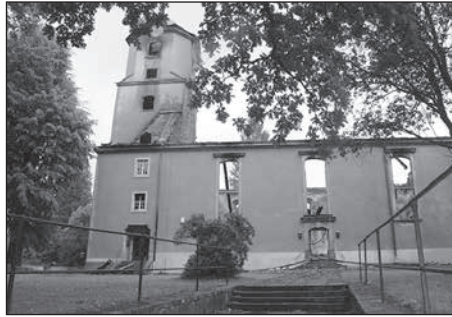
Die Grobbröhrsdorfer Stadtkirche wurde durch einen Brand in der Nacht zum 4. August komplett zerstört.