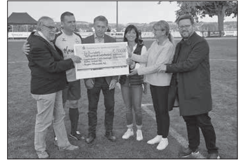
Die Anteilnahme für den Wiederaufbau der Stadtkirche ist überwältigend: unzählige Privatpersonen, wie auch Vereine sammeln Spenden, so auch der SC 1911 mit einem Benefizspiel.