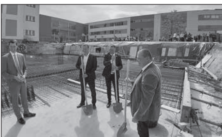
Für die Schulstandorterweiterung wurde der Grundstein am Ferdinand-Sauerbruch-Gymnasium gelegt.