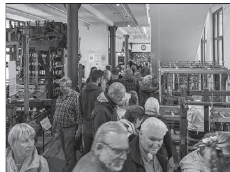
Das Fest zum 25-jährigen Bestehen des Technischen Museums lockte viele Besucher.