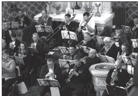
Mit einem klanggewaltigen Gottesdienst feierte der Bretniger Posaunenchor sein 40-jähriges Bestehen.