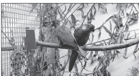
Mit 600 Gästen feiert der Ziergeflügel- und Exotenzüchter-Rödertal und Umgebung e. V. sein 60-jähriges Bestehen.