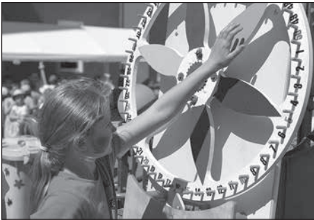
Ein kunterbuntes Fest zum Kindertag wurde auf dem Schulhof der Praßerschule gefeiert.