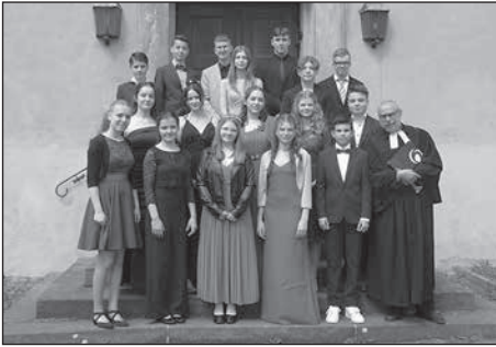
Insgesamt 29 Jugendliche wurden in den Kirchengemeinden Bretinig-Hauswalde-Rammenau und Großröhrsdorf-Kleinröhrsdorf konfirmiert.