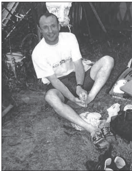
Die Wanderfreunde Bretnig-Hauswalde feiern ihren 40. Geburtstag und denken noch einmal an die Spitzenwanderer ihrer Gruppe.