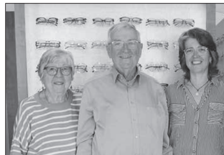
Augenoptik Demmler feiert ihr 55-jähriges Jubiläum.