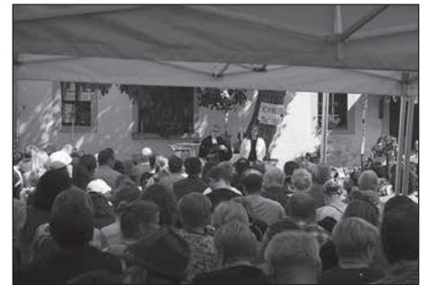
Zum 26. Mal feierte die Ev.-Luth. Kirchgemeinde Grobbröhrsdorf-Kleinröhrsdorf ihren Hofschwof.