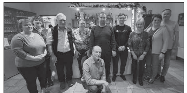
Der TSG Bretnig-Hauswalde e.V. bestimmt neuen Vorstand für die nächsten drei Jahre.