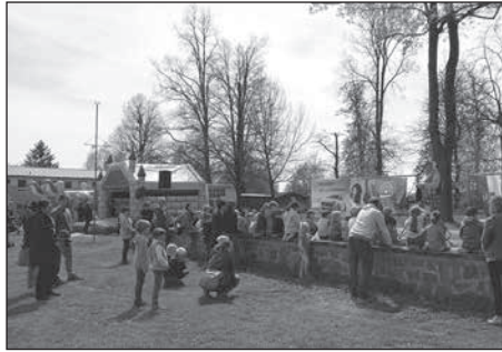
Im Bretniger Hofepark organisiert das Kulturprojekt Rödertal e.V. erfolgreich ein Maifest.