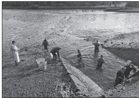
Unzählige Gäste sind beim Abfischen der Buschmühle durch den Angelverein Rödertal-Großbröhrsdorf e.V. dabei.