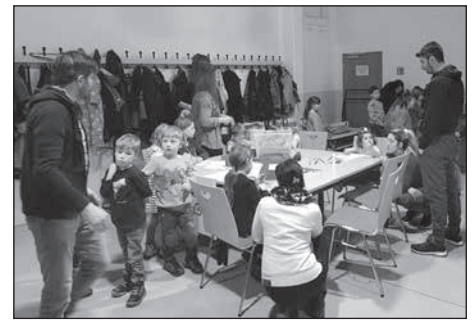
Am 12. März hatte der Verein „Einigkeit“ e. V. zu einem bunten Familiennachmittag in die Festhalle geladen.