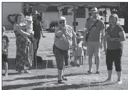
Der Heimatförderverein Bretnig-Hauswalde veranstaltet die 2. Rödertal-Olympiade.