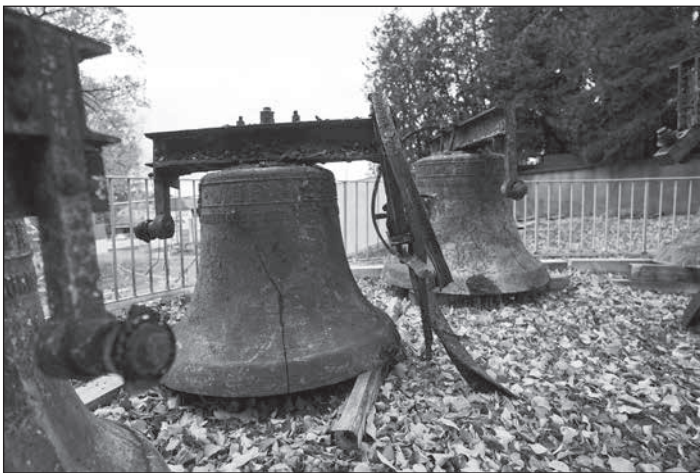
Die geborgenen Glocken

An und in der Brandruine hat sich mittlerweile einiges getan. Die Straßensperrung ist niemandem entgangen. Die großen Baukräne und die grüne Ummantelung des Turmstumpfes sind ebenfalls nicht zu übersehen. Jedem Blick Richtung Kirche folgt unweigerlich die Frage nach dem, was hinter den Bauzäunen eigentlich passiert. Eine Kirche ist eben nicht nur für eine Kirchgemeinde der Mittelpunkt geistigen Lebens, sondern hat immer auch eine weitreichende Bedeutung für die gesamte Stadt und darüber hinaus. Wir möchten daher von nun regelmäßig einen Überblick über den aktuellen Stand der bisherigen Arbeit der Kirchgemeinde nach dem Kirchenbrand geben, über Inhalte und Fortschritte der gebildeten Arbeitsgruppen berichten und mögliche Ausblicke in die Zukunft mit Ihnen teilen.