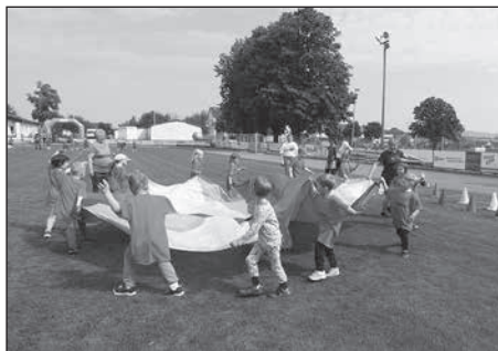
Für die Kindertagesstätten in Großröhrsdorf wurde dieses Jahr das erste Kindersportfest organisiert.