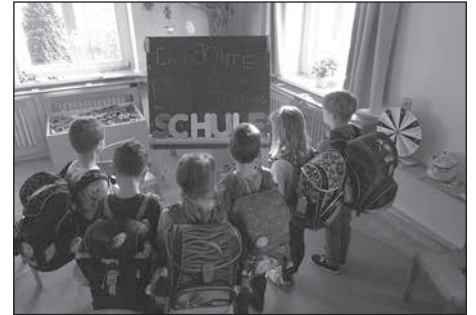
In der Ev.-Luth. Kita „Agnesheim“ konnte erneut der Schulanfänger-Erzähl-Tag stattfinden.