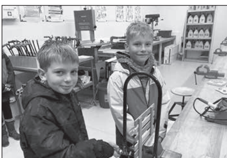
Das Interesse zum Tag der offenen Tür in der Oberschule Rödertal war enorm und lässt auf zahlreiche Anmeldungen hoffen.