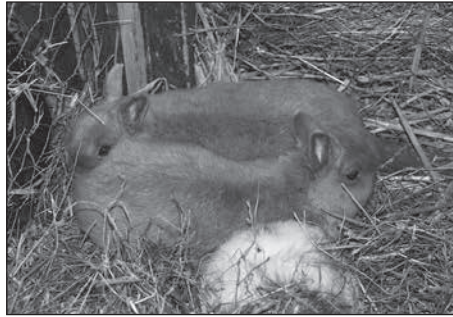
Mehr als 350 Tiere gab es am letzten Novemberwochenende zur 61. Rassekaninchen-Kreisverbandsschau zu sehen.