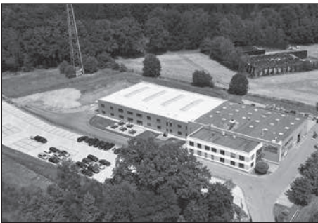
ONI Temperiertechnik Rhytemper GmbH verdoppelt Produktionsstandort.