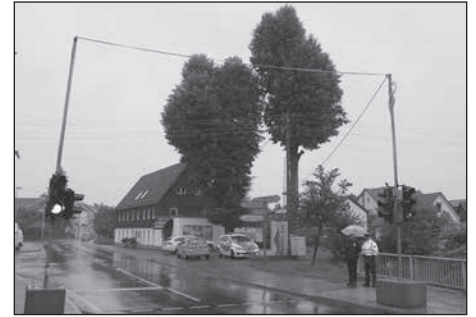
Eine mobile Fußgängerampel an der Radeberger Straße soll den tatsächlichen Bedarf erfassen.