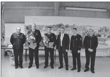
Am 21. Januar 2023 fand die Jahreshauptversammlung der Stadtteilfeuerwehr Großröhrsdorf inklusive Auszeichnungen und Beförderungen statt.