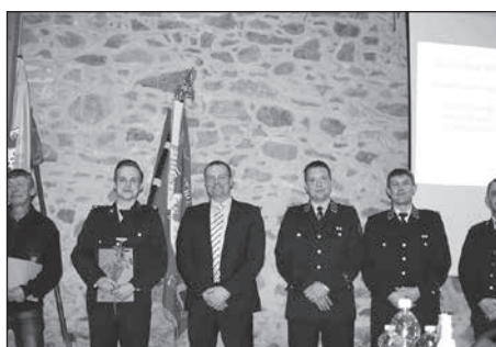
Auch die Freiwillige Feuerwehr Bretnig-Hauswalde überreichte Ehrungen und Auszeichnungen zur Jahreshauptversammlung.