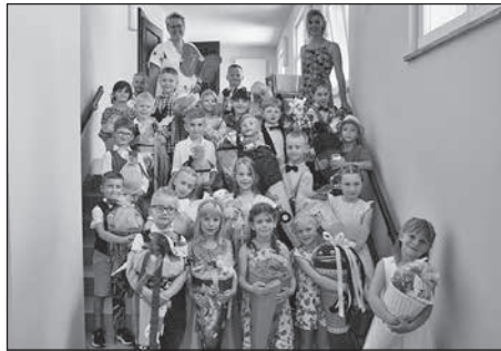
105 Mädchen und Jungen wurden in die Praßerschule und die Grundschule Bretnig-Hauswalde eingeschult.