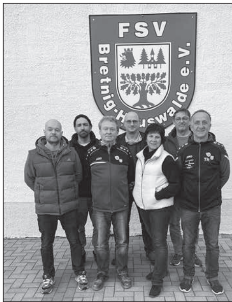
Der FSV Bretnig-Hauswalde e.V. wählt einen neuen Vorstand.