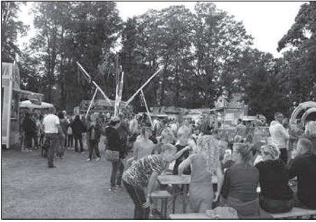
Auch dieses Jahr war die Bretniger Kirmes viel besucht.