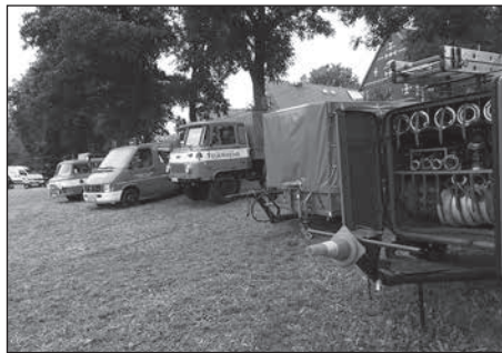
Die Freiwillige Feuerwehr Kleinröhrsdorf feiert am 26. und 27. August 90-jähriges Bestehen.