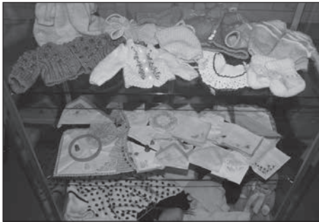
Das Heimatmuseum zeigt eine Sonderausstellung „Kreatives mit Nadel und Faden“.