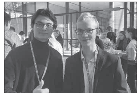
Das Ferdinand-Sauerbruch-Gymnasium nimmt erfolgreich am 20. Jugend-RedeForum teil.