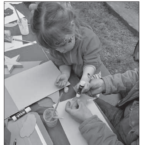
In den Kitas „Bummiland“ und „Regenbogenland“ sowie in der Kita Bretinig feierten Kinder Sommerfeste.