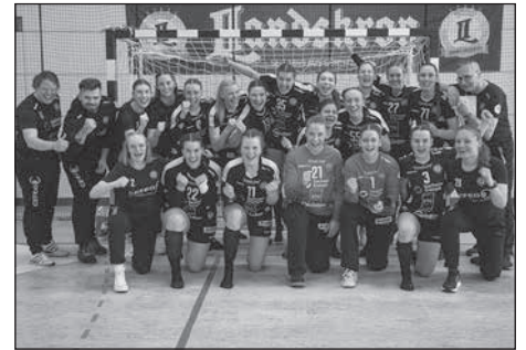
Der HC Rödertal verabschiedete sich mit einem letzten Heimsieg in die Sommerpause.