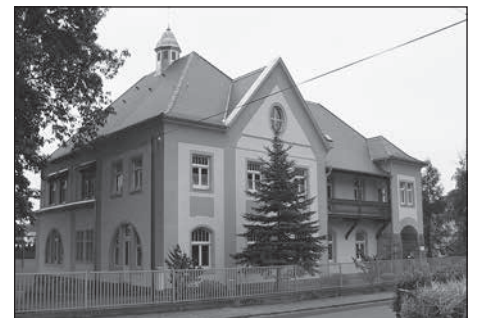
Die Ev. Kita „Agnesheim“ begeht mit einer Festwoche ihr 15-jähriges Bestehen.