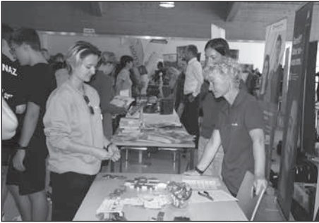
Mehr als 50 regionale Unternehmen und Institutionen präsentierten sich beim Tag der Ausbildung in der Festhalle.