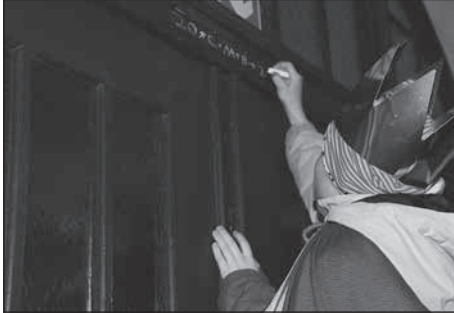
Anfang des Jahres waren die Sternensinger zu Besuch im Rathaus.