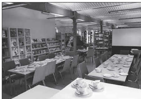
Ein flexibler Bereich bietet nun multifunktionale Nutzungsmöglichkeiten, so dass Veranstaltungen seit Januar direkt in der Bibliothek durchgeführt werden können.