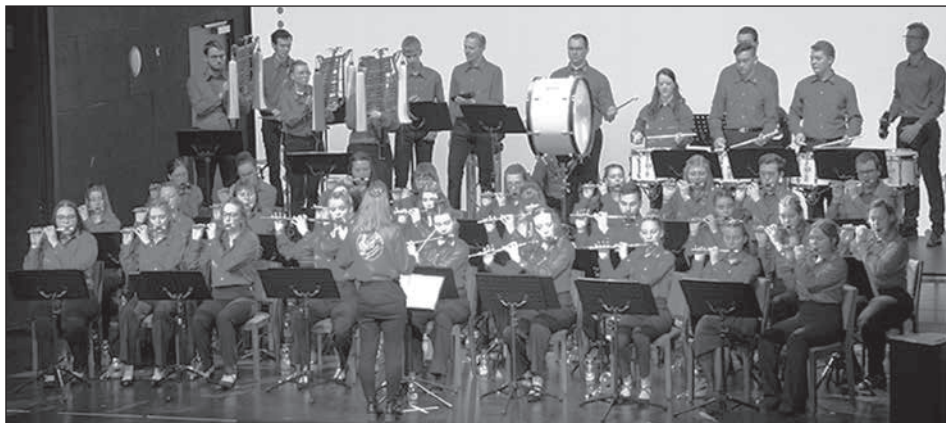
Mit einer Reise durch verschiedene Musikgenres verzauberte der Spielmannszug Kleinröhrsdorf sein Publikum im Rödersaal.