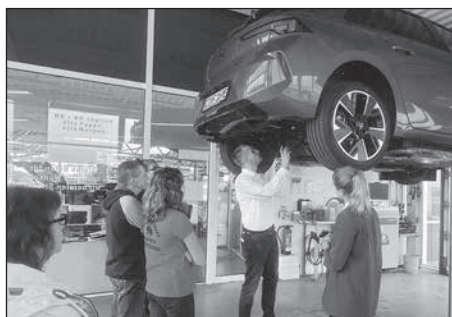
Zur 1. Spätschicht lassen 12 Unternehmen erstmals Interessierte hinter die Kulissen schauen.