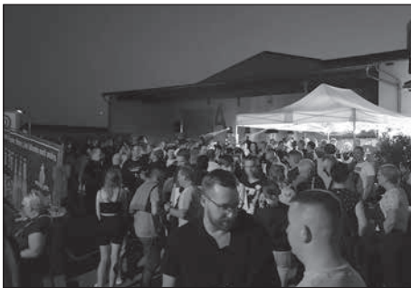
Gemeinsam mit dem Jugendclub Hauswalde organisiert das Kulturprojekt Rödertal e.V. das Open Air in Hauswalde.