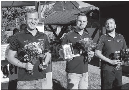
SG Kleinröhrsdorf e. V. – Abteilung Kegeln feiert ein Sommerfest an der Kegelbahn.