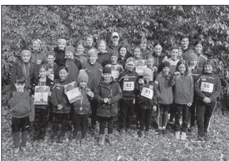
Die SG Großröhrsdorf Leichtathletik nahm erfolgreich an der Kreismeisterschaft im Crosslauf teil.