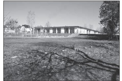
Auf der freien Fläche neben der Grundschule Bretnig entstehen neue Umkleiden für Schule und Sport.