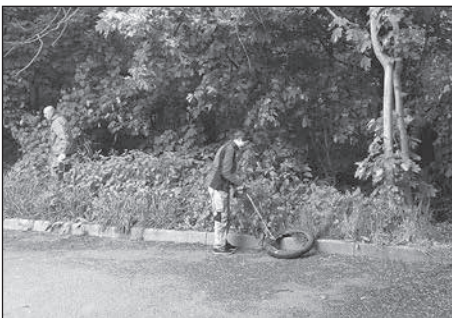
Mitarbeiter der Southwall Europe GmbH beraumten illegale Müllentsorgungen.