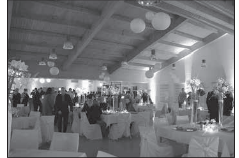
Im Anschluss an den Neujahrsempfang lud der Gewerbeverein Rödertal und Umgebung e.V. erstmalig zum Neujahrstanz ein.