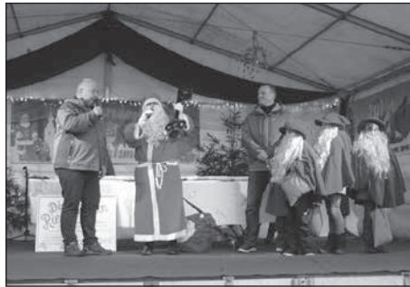
Der Nikolaus mit seinen Wichteln besucht am 2. Adventswochenende den Großröhrsdorfer Weihnachtsmarkt.