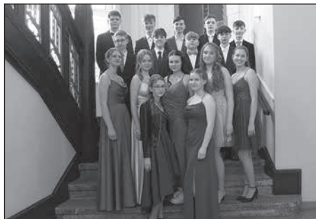
59 Jugendliche aus der Oberschule Rödertal und 62 Jugendliche des Ferdinand-Sauerbruch-Gymnasiums erhielten ihre Jugendweihe.