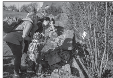
Frühlingsfest im Kindergarten „Zauberwald“