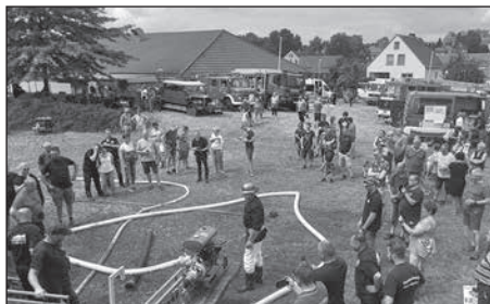
Die Freiwillige Feuerwehr Großröhrsdorf feiert stolze 150 Jahre.