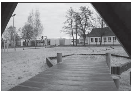
Zum Bau des neuen Spielplatzes an der Walther-Rathenau-Straße unterzeichnen Gewerbeverein Rödertal und Umgebung e.V. und Stadt einen Kooperationsvertrag.