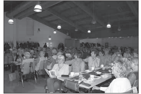
Es weihnachtet sehr bei der Seniorenfeier im Rödertal.