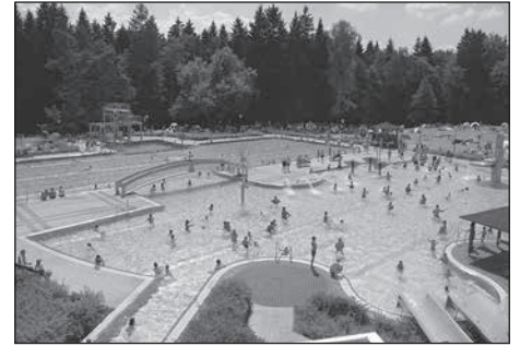
Pünktlich zum Kindertag startet das Massenei-Bad in die Saison.