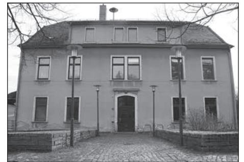
Der Umbau der alten Schule zum Gemeindezentrum im Ortsteil Hauswalde beginnt.