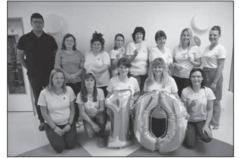
Mit einer Festwoche zelebriert die Kita „Erfinderkinder“ ihren 10. Geburtstag.