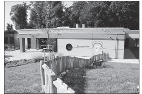
Der Umzug der Kita „Bummiland“ in ihr neues Gebäude muss noch einmal verschoben werden.