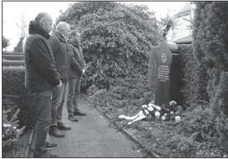
Zum Volkstrauertag wurde an die Kriegstoten und Opfer der Gewaltherrschaft gedacht.