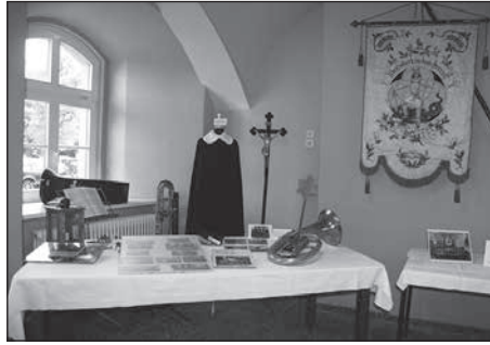
In diesem Jahr stand die Kirmes unter dem großen Thema „120 Jahre Bretniger Kirche“.