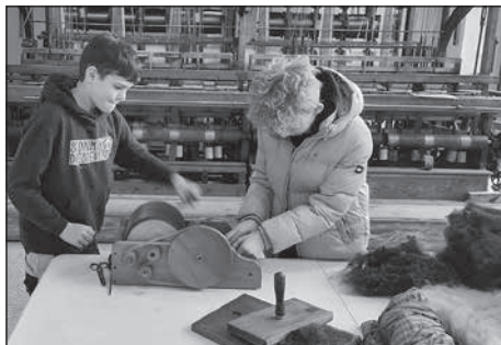
Im Sinne der Textilprojekttag besuchten die Schüler der Oberschule Rödertal das Technische Museum sowie auch die Firma F. A. Schurig.