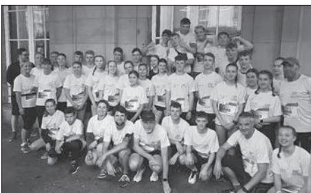
Mit 40 Teilnehmern trat das Ferdinand-Sauerbruch-Gymnasium bei der Rewe Team Challenge 2023 an.