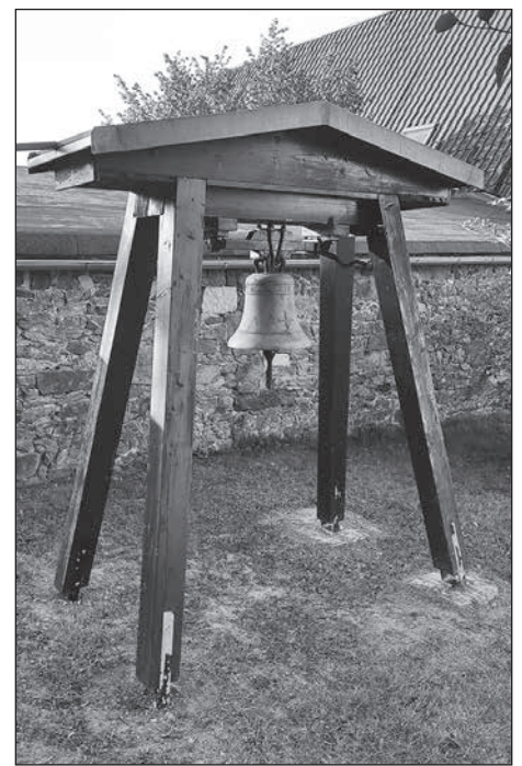
Nach dem verheerenden Brand der Stadtkirche erhält die Kirchgemeinde großartige und vielfältige Unterstützung, wie z.B. eine Kirchenglocke.