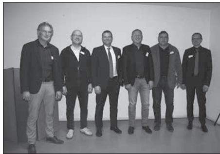
Das 17. Firmen-Info-Treffen findet bei Frauenrath statt.