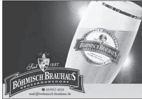
Nach 130-jähriger Brautradition stellt Böhmisches Brauhaus die Produktion im Februar ein.