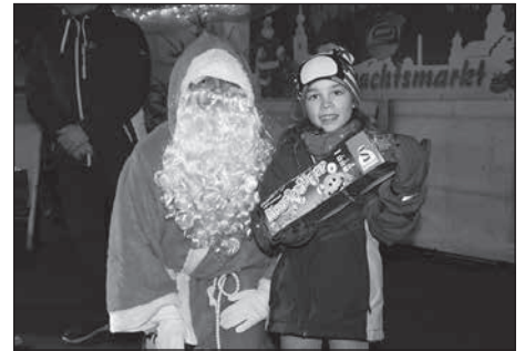
Die Gewinnerin des Kinder-Weihnachtsrätsels mit dem Nikolaus.