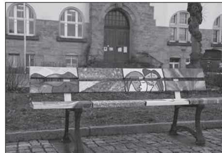
Schüler gestalten Kunst-Bänke vor dem Rathaus.