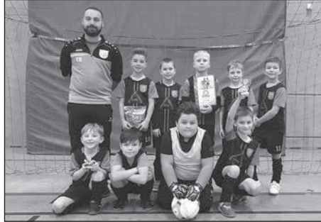
Der FSV Bretnig-Hauswalde erkämpft sich den 4. Platz beim 22. Hallencup.