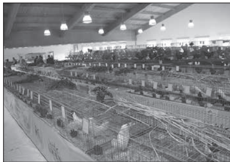
Seit 125 Jahren existiert der Rassegeflügelverein Großbröhrsdorf e.V. Mit einer Kreis-Rassegeflügel-Ausstellung feierte der Verein sein besonderes Jubiläum.