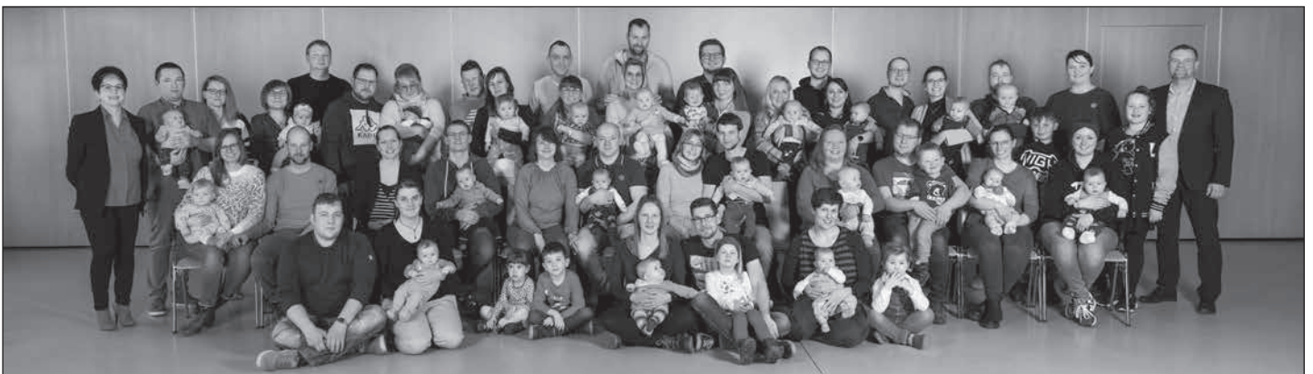
21 Mädchen und 21 Jungen lud der Bürgermeister zum Neugeborenenempfang ein.