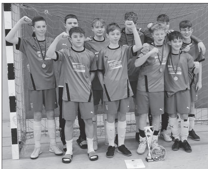
Silber für die C-Junioren beim Hallenturnier in Radibor.

Nun war Aufbauarbeit durch die Trainer gefragt. Nach einem durch den Chefcoach ausgelobten Imbiss ging es dann auf die Heimreise.