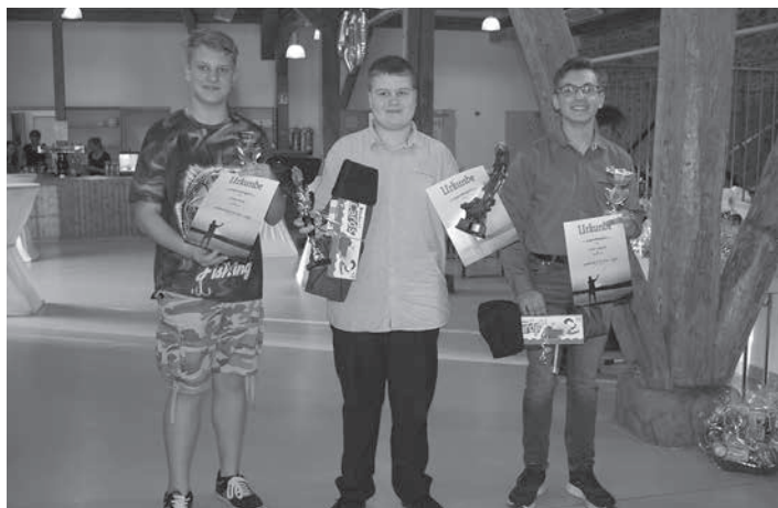
Auszeichnung der Preisträger des Hegeangels (Nachwuchsgruppe)

Seine Ausführungen fanden durchweg Zustimmung bei den Zuhörern.