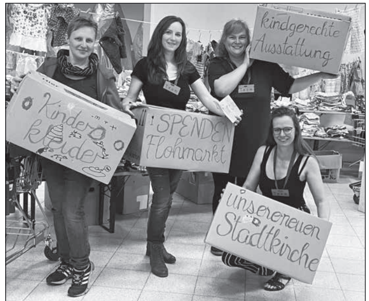
Orgateam des Kinderkleider-Spendenflohmarktes

Mit Freude und großer Dankbarkeit blicken wir auf den Kindersachen-Spenden-Flohmarkt zurück. Viele Familien kamen zum Stöbern und Shoppen für den guten Zweck in den Rödertalpark und spendeten insgesamt überwältigende 3110 Euro für die ausgewählten Kindersachen. Insgesamt kamen so durch die beiden ersten Flohmärkte 5.433 Euro zusammen, die zweckgebunden zu 100% der kindgerechten Ausstattung unserer neuen Stadtkirche zugutekommen. Wir möchten uns an dieser Stelle bei der Deutschen Investment, dem Center Management des Rödertalparkes bedanken, welche uns dies durch die kostenfreie Nutzung der derzeit leerstehenden Ladenflächen mit ermöglicht haben. Auch ohne die vielen gut bzw. sehr gut erhaltenen und sogar neuen Kleiderspenden, die kostenfreie Transportmöglichkeit und den kostenfreien Lagerraum, die vielen Helfer und großzügigen Spenden wäre das alles nicht möglich gewesen.