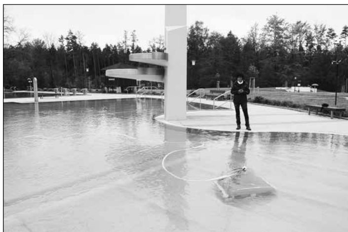
Reinigung des Schwimmbeckens mit dem Saugroboter

Bereits Ende Februar hatte das Badteam mit der Reinigung des Beckens begonnen. Alle Kanäle, der Sprungturm und die Wasserrutschen wurden gesäubert und von den Spuren des Vorjahres sowie dem Winter befreit. Dank guter Witterung kamen die Schwimmmeister und ihre Helfer schnell voran, so dass bereits nach Ostern das Becken gefüllt werden konnte. Der zeitige Start war nötig, um die neue Steuertechnik, welche für die Aufbereitung des Wassers zuständig ist, programmieren zu können. Erst nach erfolgreichem Testlauf kann in die Saison 2024 gestartet werden. Rund 80.000 € investierte die Stadt, um das „Herzstück“ - die Steuertechnik aus dem Jahr 1995 - auszutauschen.