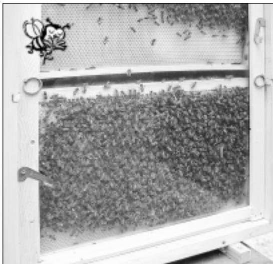
Innenleben eines Bienenstocks

Derzeitig hat unser Bienenzüchterverein 20 Mitglieder. Erfreulich ist, dass wir in unserer Jahreshauptversammlung im Januar 2007 drei neue Mitglieder aufnehmen konnten. Insgesamt werden ca. 200 Bienenvölker gehalten.