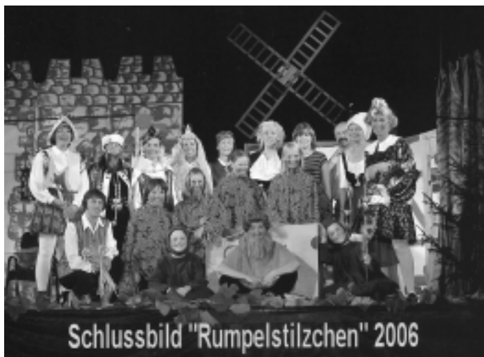
Schlussbild "Rumpelstilzchen" 2006

Wer diese Termine nicht wahrnehmen kann und uns trotzdem erleben möchte, für den noch eine Vorschau: